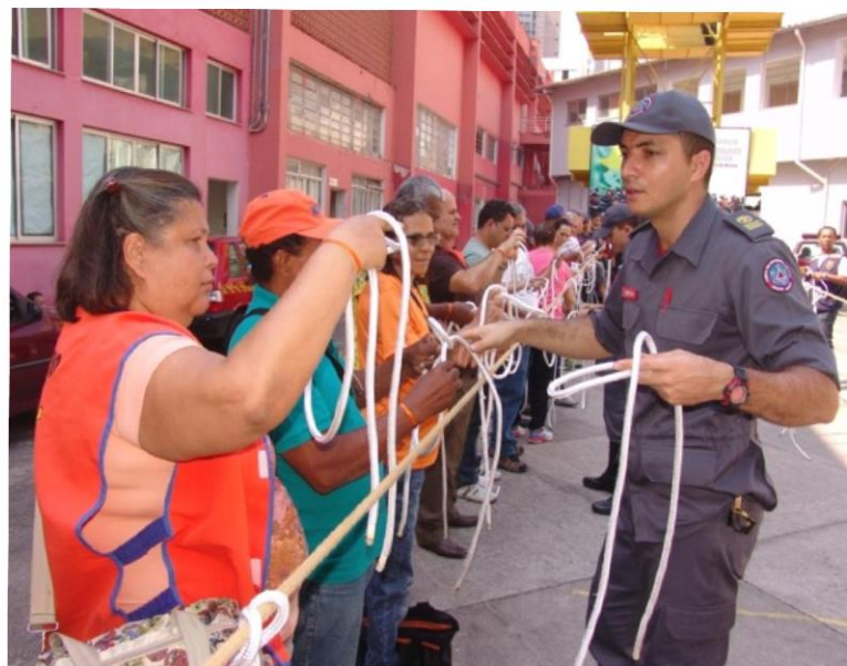
Oficina de nós e amarrações