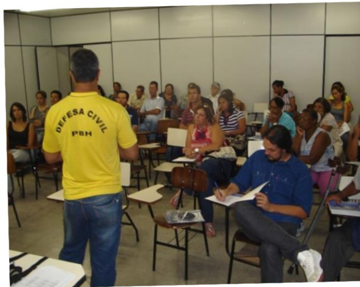
Assembleia de formação e capacitação de núcleos