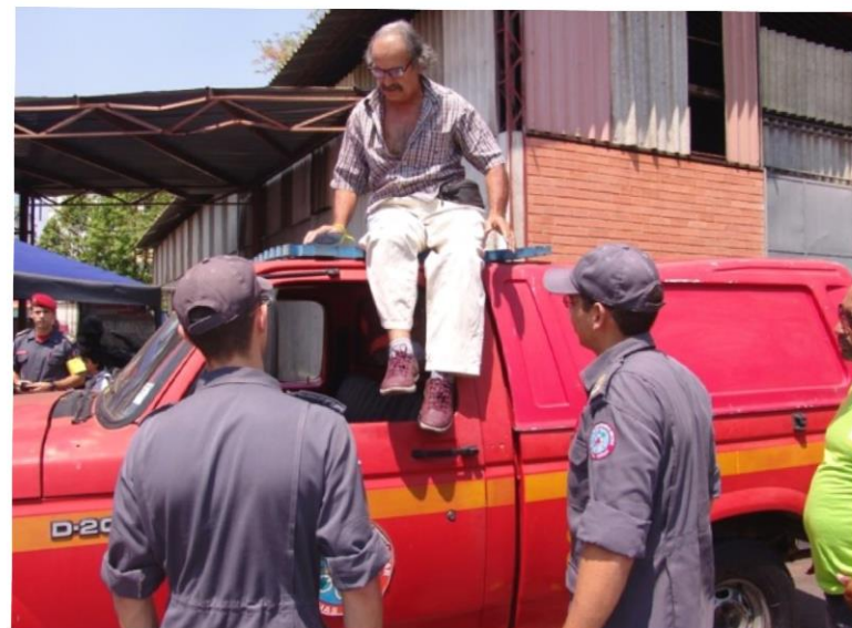
Oficina de veículos em enchentes