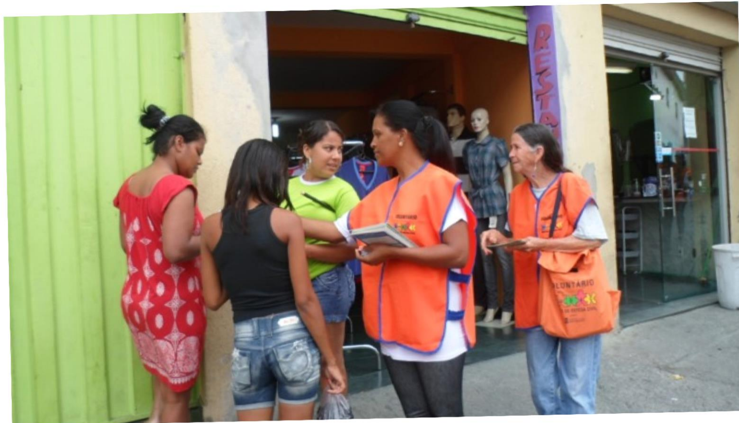
Mobilização porta a porta realizada por voluntários do NUDEC preparação das comunidades para o período chuvoso