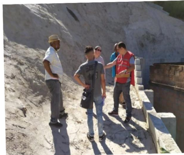
Visita técnica para troca de experiências