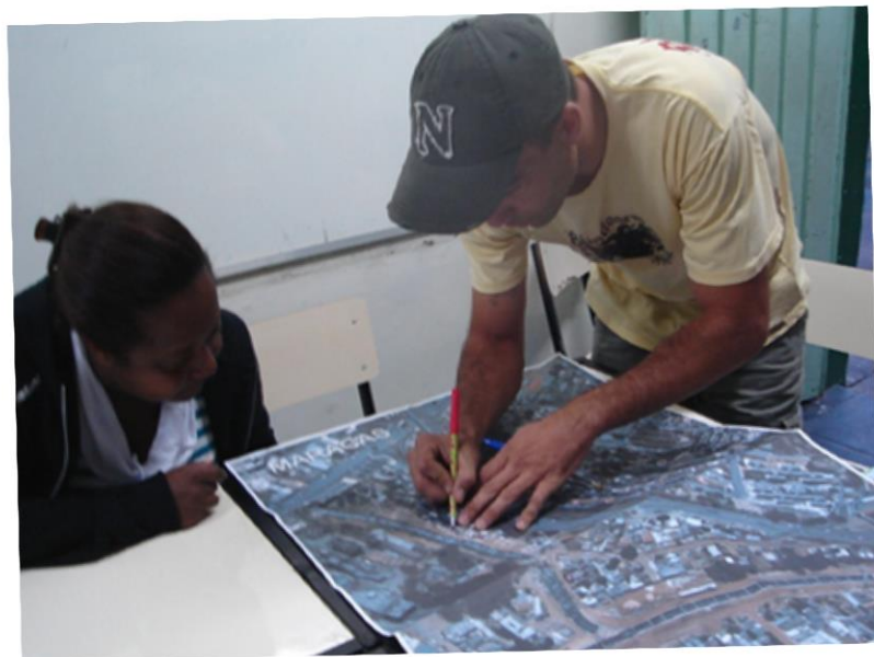
Voluntário do NAC desenhando mancha de inundação da própria comunidade