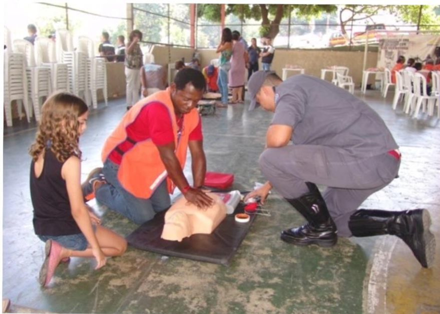
Oficina de primeiros socorros

Treinamento Corpo de Bombeiros Nac e Nudec