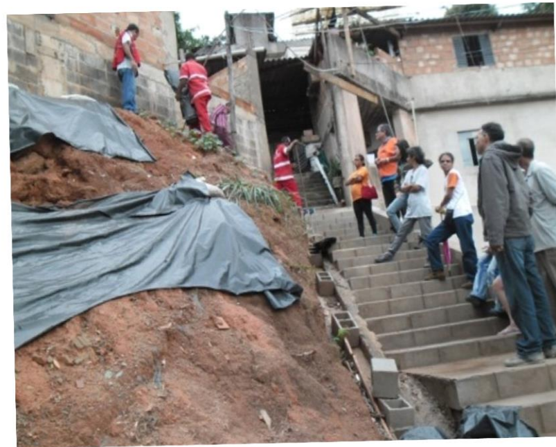
NUDEC acompanhando vistoria de família em área de risco