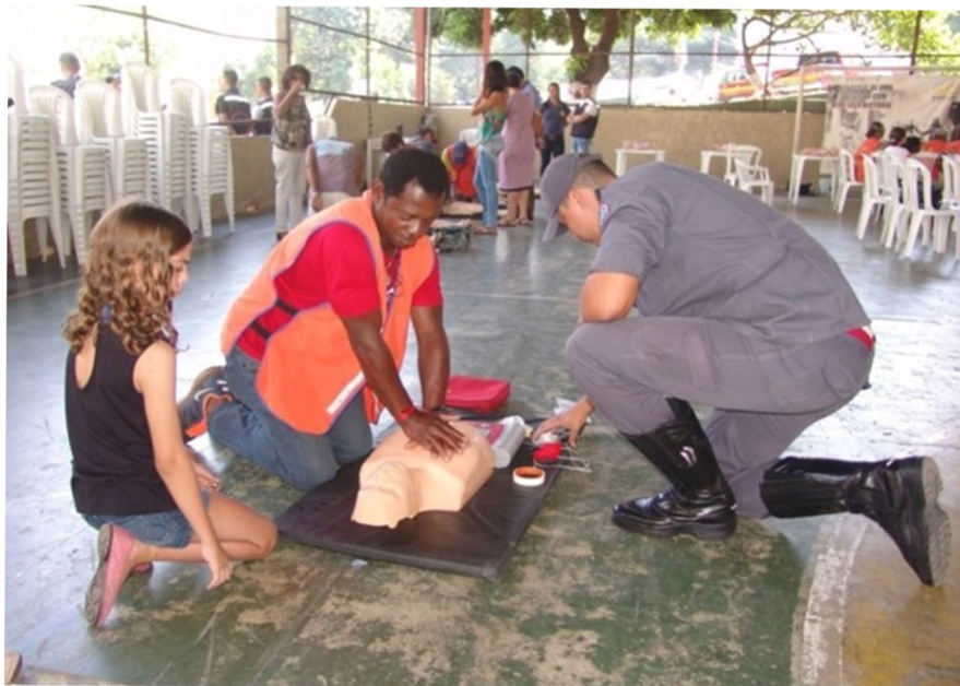
Oficina de primeiros socorros