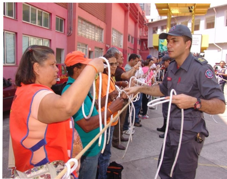
Oficina de nós e amarrações