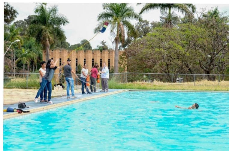
Oficina de sobre lançamento de corda a pessoas em enxurradas