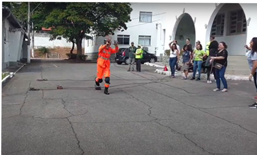
Oficina de lançamento de corda a pessoas ilhadas