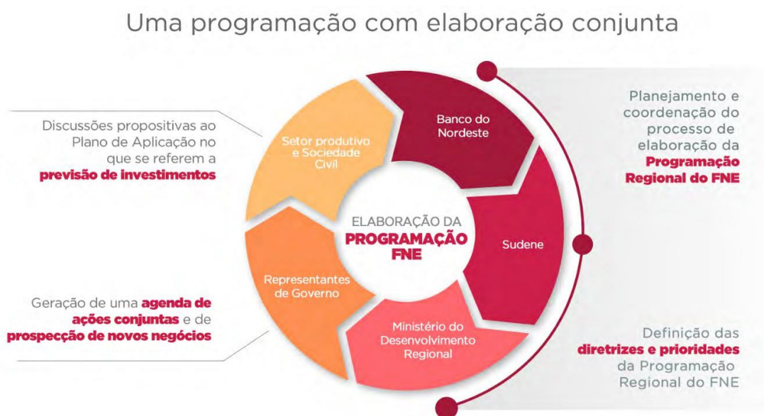
Figura 1. Atores envolvidos na elaboração da Programação do FNE

A figura 1, abaixo, evidencia a participação desses atores no processo de programação dos recursos do FNE, coordenado pelo Banco do Nordeste, Sudene e MIDR: