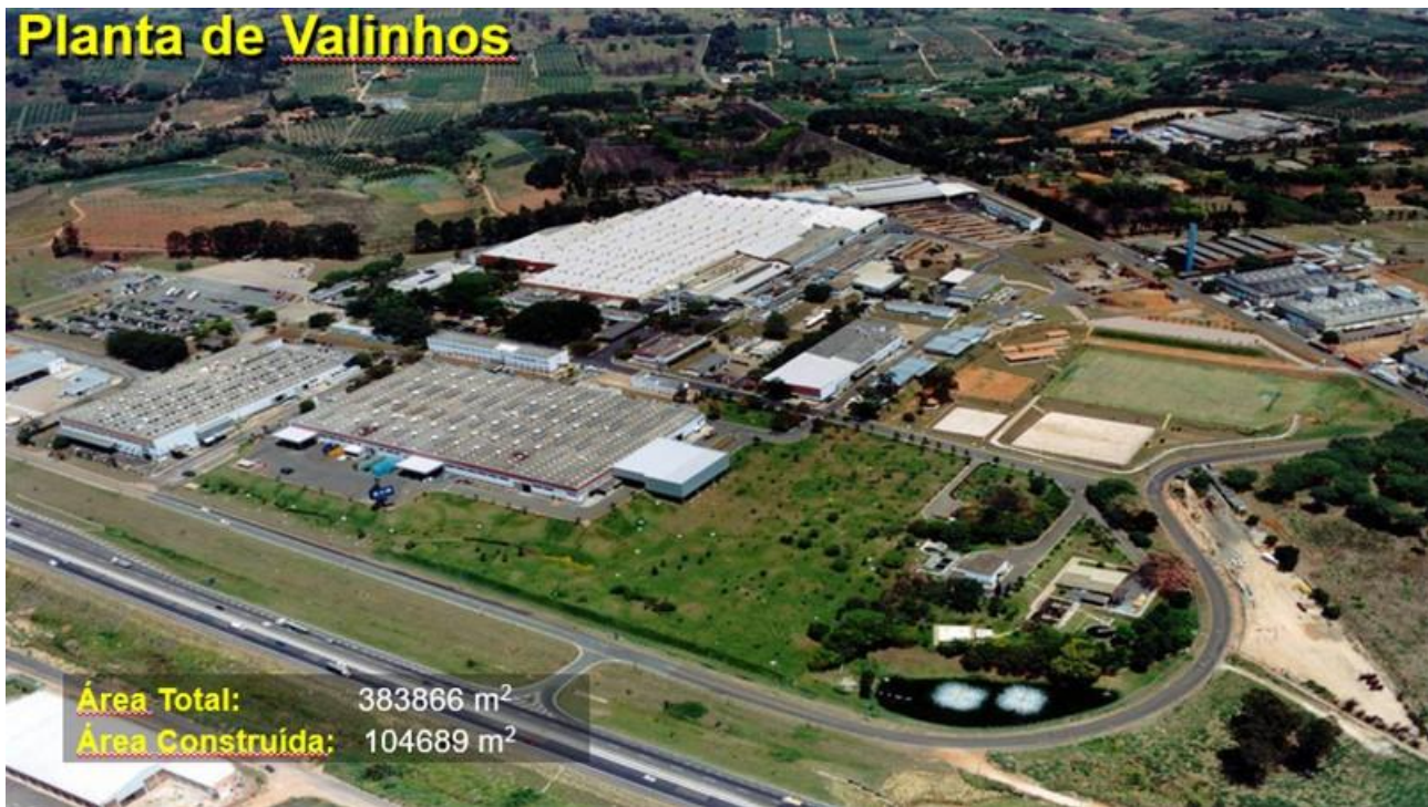
Foto da fábrica de Valinhos