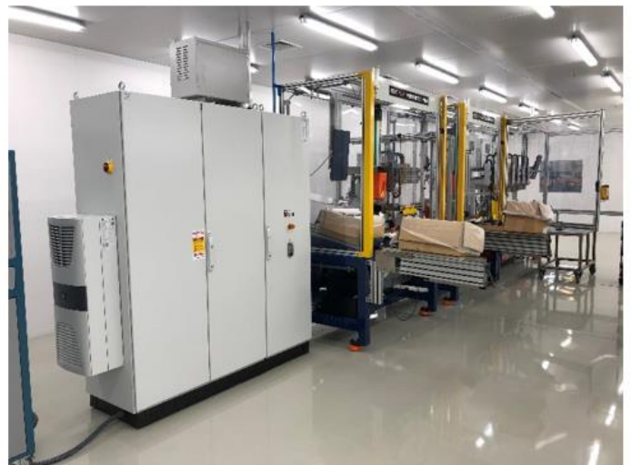
Fotos das linhas de produção das válvulas do sistema ORVR (Onboard Refueling Vapor Recovery)