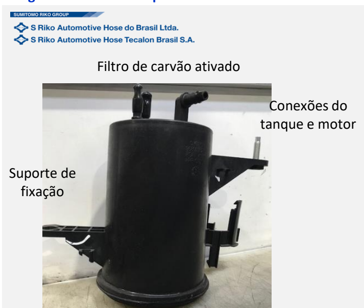
Imagem ou desenho esquemático

Canister de carvão ativado para filtragem de gases de combustível, com flange integrada para fixação no tanque de combustível, suporte para filtros de poeira, válvulas de pressão, válvulas de vácuo e bomba de vácuo para estanqueidade do sistema de combustível, capaz de gerar pressão até 500 mbar.