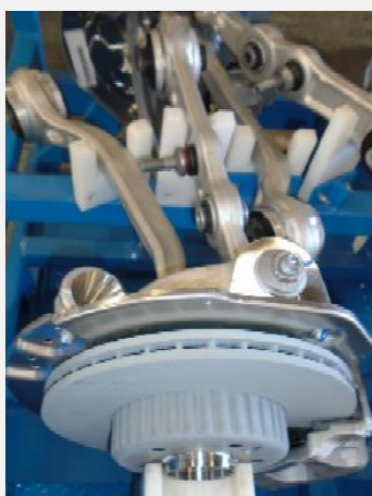
Imagem ou desenho esquemático

Ex 001 - Freio do eixo dianteiro esquerdo ou direito, fabricado em aço e suas liga, alumínio e borracha, composto por pinça de freio, disco de freio, dois braços de controle e braço da suspensão em alumínio.