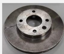
Imagem ou desenho esquemático

Conjunto de freio a disco do eixo dianteiro, lado esquerdo ou direito, formado por pinça de freio de serviço e disco de freio, montados junto ao eixo dianteiro e solidário a roda, servindo para gerar atrito entre as pastilhas da pinça de freio com o objetivo de desacelerar o veículo.