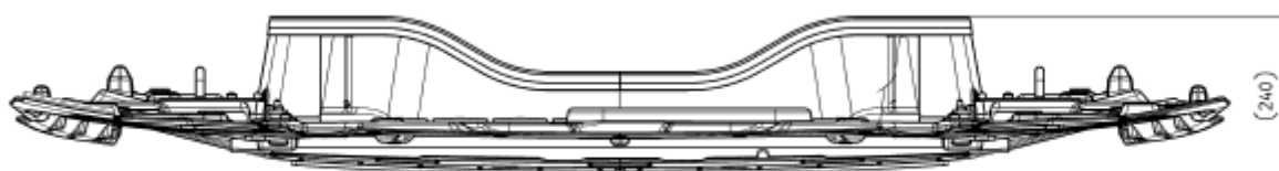
Imagem 2 – Vista Superior