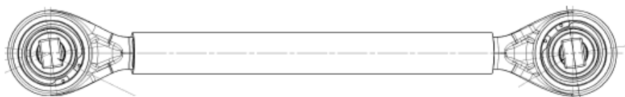
Imagem 2 – Vista Superior