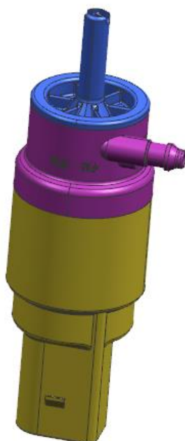
Imagem 2 – 3D