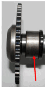
Figura 3: detalhe de aplicação do rolamento no comando de válvula.