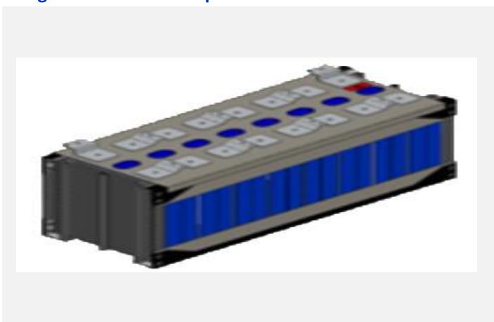
Imagem ou desenho esquemático

Módulo de bateria de íon de lítio (LiFePO4); contendo fosfato de ferro, lítio, alumínio, polímeros, silício, resistores, capacitores, transistores, indutores e cabos; ligações em série com correntes que podem variar de 40 a 345 Ah (incluindo 50Ah), tensões variáveis de 6,4 a 153V - nível submódulo (incluindo 51,2V), e variações conforme o nível de agrupamento de células, ou módulos. Energia de 256 a 19872 Wh e variações conforme corrente nominal da célula e química utilizada. Para células de 50Ah, comprimento 525mm (+3mm), largura 137mm (+1mm), altura 192mm (+2mm), peso de 35,5kg. Para demais células, variações dimensionais e de peso, conforme células e aplicações. Para fabricação de bateria automotiva ou acumuladores de energia em baterias; com função de compor a parte de potência da bateria ou pack de baterias; com aplicação em veículos comerciais leves, caminhões, ônibus, máquinas agrícolas autopropulsadas, máquinas rodoviárias autopropulsadas, sistemas de propulsão naval, e similares. Com sistema de refrigeração a ar ou água.