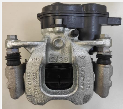
Imagem ou desenho esquemático

Pinça de freio traseira com pistão de diâmetro 34 a 45 mm contendo pastilhas de freio com indicador de desgaste mecânico, molas de retorno das pastilhas e motor elétrico para função de freio estacionamento elétrico (EPB); composto predominantemente por ferro fundido e aço, e peso de 3,0 a 7,0 kg.