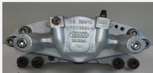
Imagem ou desenho esquemático

Conjunto de Caliper de freio para ser montado em veículos automotores comerciais ou de passeio, com área de atrito de até 83 cm2 por pastilha, com atuação somente em freio de serviço, com peso total de 8 kg, com pistão de no maximo Ø76 mm, homologado para trabalhar com fluido classe DOT 4 e acima, montado em disco de freio com dimensões de até Ø305 X 30 em eixos dianteiro. Torque de frenagem máximo de até 7707 Nm.