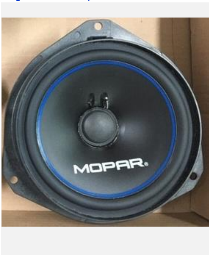
Imagem ou desenho esquemático

Alto-falantes de larga banda com frequência entre 60 Hz a 20.000Hz, montados em um receptáculo, com diâmetro que varia de 30mm a 320mm, potência máxima variando de 1W a 150 W, impedância nominal variando de 2 ohms a 55 ohms, os quais são utilizados no setor automotivo com conector de 2 ou 4 vias.