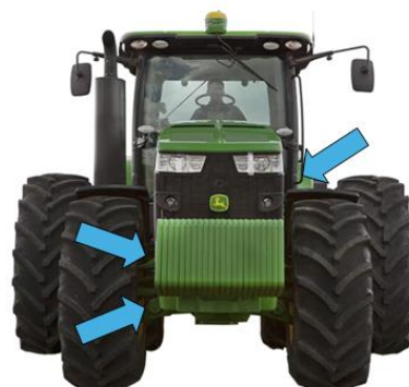
Exemplo da utilização dos atuadores em Trator