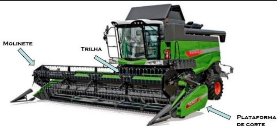
Exemplo da utilização dos atuadores em colheitadeira de grãos