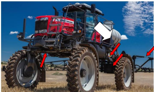
Exemplo da utilização dos atuadores em Pulverizador

Utilizados em máquinas autopropelidas, que são equipamentos que se deslocam no solo com um sistema de propulsão próprio. Alguns exemplos de máquinas nas quais o item é aplicado são: Colheitadeiras, Ceifadeiras, Pulverizadoras e Tratores.