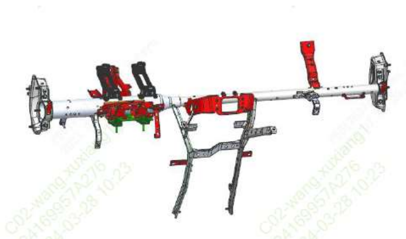
Figura 1 - Vista Geral