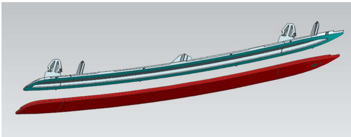
Figura 3 - Vista de montagem

O refletor traseiro é utilizado em veículos elétricos/híbridos.