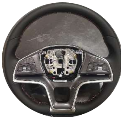
Figura 1 - Vista do volante