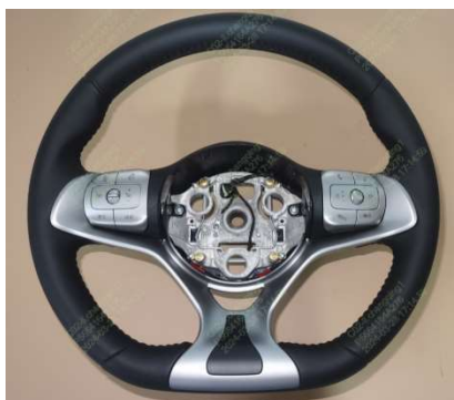
Figura 1 - Vista do volante