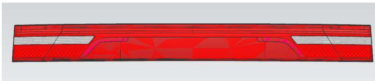
Figura 1 - Vista frontal