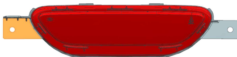
Figura 1 - Vista frontal