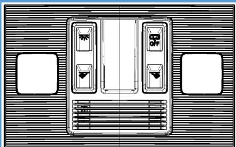
Lâmpada / LED sem interruptor do teto solar