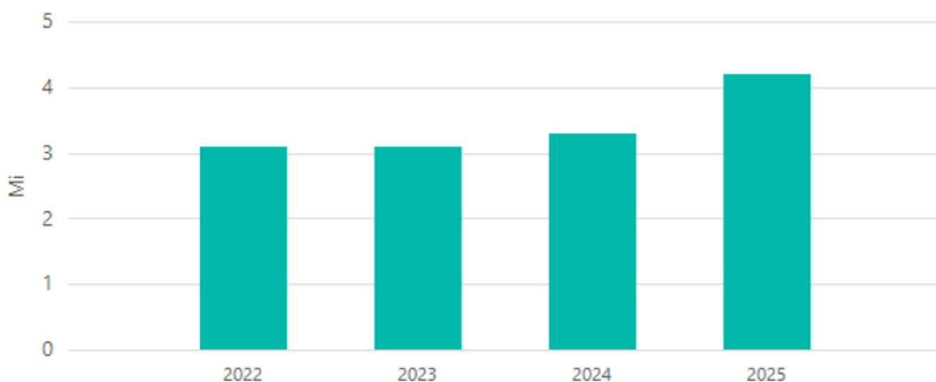
Gráfico 2 - Exportação em quantidade [Kg] - NCM 3304.99.90