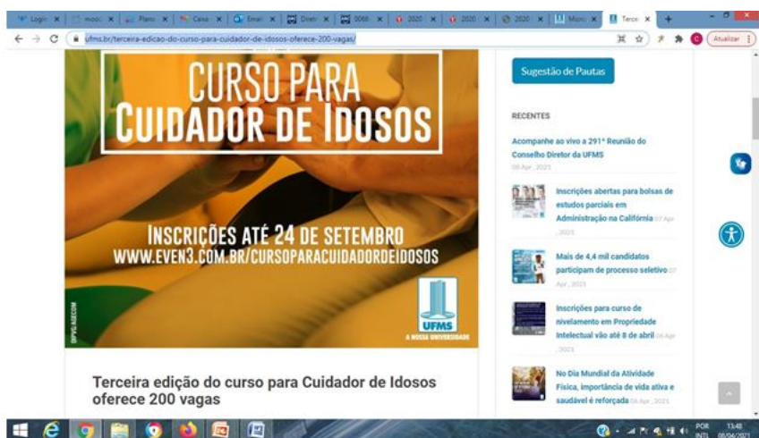
Figura 2. Curso para cuidador de idosos. https://www.ufms.br/terceira-edicao-do-curso-para-cuidador-de-idosos-oferece-200-vagas/

4.6. Considerando as ações de formação e aperfeiçoamento profissional, destacamos o Curso para Cuidador de Idosos (Figura 2), centrado no paciente e no trabalho interprofissional em saúde. O curso está inserido no âmbito do Programa UnAPI/UFMS e do Programa de Residência Multiprofissional em Cuidados Continuados Integrados e possui o objetivo de qualificar cuidadores de idosos das Instituições de Longa Permanência para Idosos (ILPIS) de Mato Grosso do Sul, assim como cuidadores da comunidade, de forma a contribuir para o desenvolvimento de habilidades e competências para o enfrentamento das demandas advindas do envelhecimento humano. Até o presente momento, três turmas anuais foram ofertadas e 137 cuidadores foram certificados.