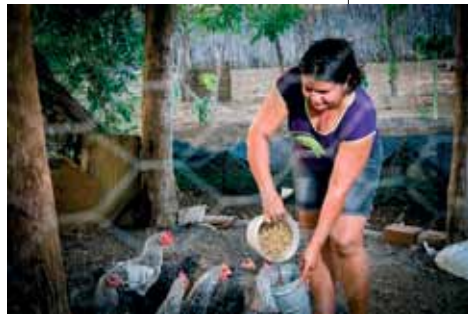
Apodi, Rio Grande do Norte