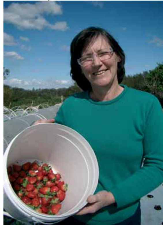
Rio Grande do Sul

na definição de critérios para escolha de pessoas a serem entrevistadas, bem como de modelos diferenciados de questionários segundo a área de atuação de cada ator/atriz, contendo perguntas abertas e fechadas. O quadro de entrevistadas/os priorizou: mulheres lideranças e de base; mulheres de grupos produtivos; gestores e gestoras das políticas públicas do MDA para a igualdade de gênero no âmbito estadual e territorial; técnicos e técnicas de organizações não governamentais (ONGs) e extensionistas das entidades oficiais de ATER (Emater, Endagro, IPA, EBDA).