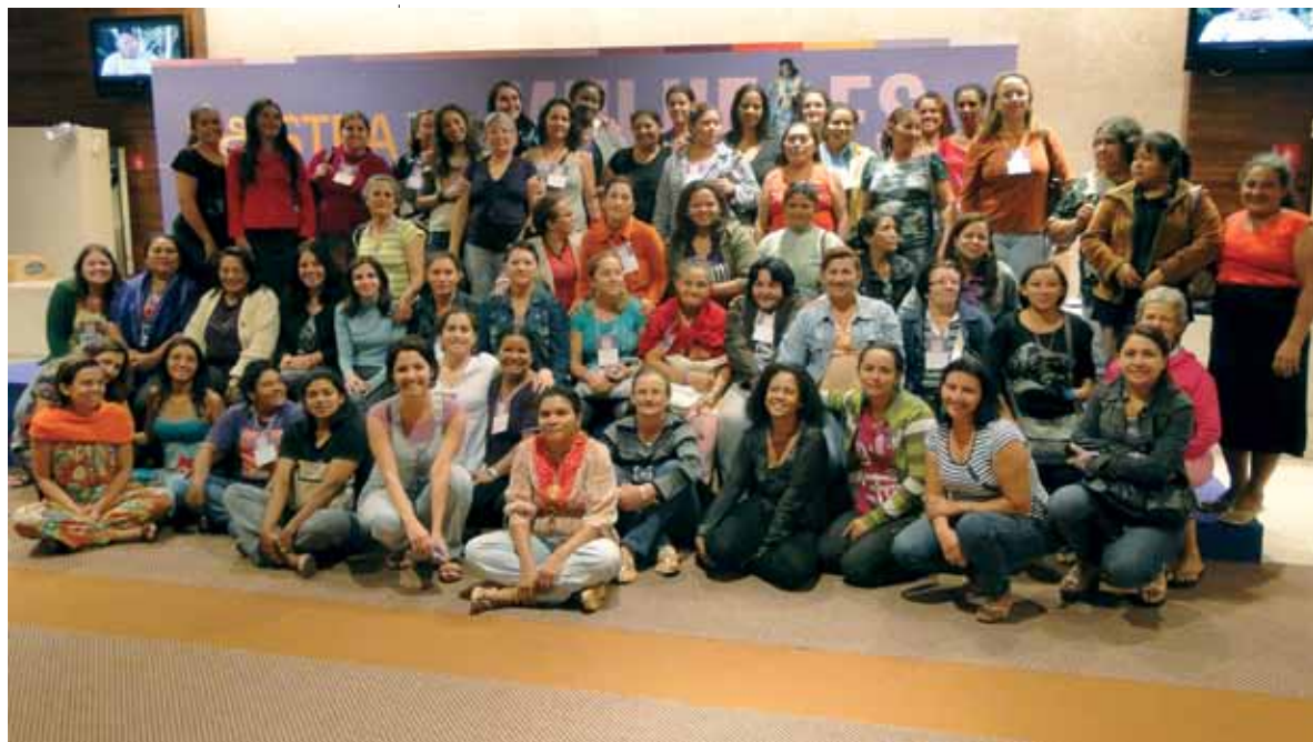
I Mostra de Organização Produtiva das Mulheres Rurais no Brasil, Distrito Federal, novembro de 2010

objeto de discussão no II Encontro Nacional de Comitês de Mulheres, realizado como parte da agenda de atividades do Dia Internacional das Mulheres, em março de 2014.