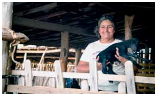
Apodi, Rio Grande do Norte

ção do CF8 e da SOF. É a partir desse processo que haverá mudanças nas relações desiguais de gênero, inclusive a superação da invisibilidade e exclusão das mulheres em relação às políticas públicas. Os projetos realizados em parceria com a DPMR/MDA combinaram de forma permanente estratégias de formação e articulação e, desse modo, contribuíram para uma maior institucionalização das políticas para as mulheres no desenvolvimento territorial. Sem desconsiderar as inúmeras iniciativas de formação e capacitação desenvolvidas pelos movimentos sociais do campo, este processo permitiu uma atuação de largo alcance: abrangeu todos os estados brasileiros e envolveu diretamente mais de 47 mil pessoas, a grande maioria mulheres, inclusive aproximando aquelas que naquele momento não tinham ou tinham pouca relação com movimentos estruturados nacionalmente. A sintonia construída com o conjunto de atores e atrizes sociais dos territórios possibilitou que o desenvolvimento das ações do projeto não se configurasse em uma substituição das dinâmicas já existentes no local, mas, sim, no