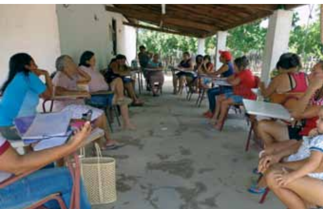
Upanema, Rio Grande do Norte