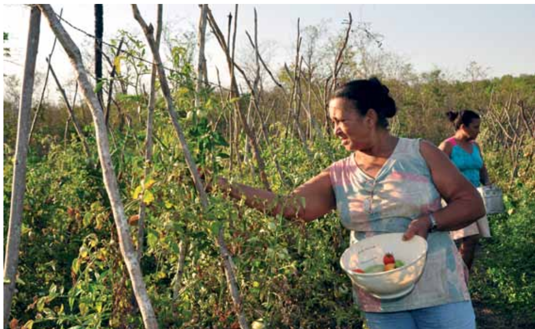
Mato Grosso do Sul

capacidades. Essa ocorrência revela que a renda é importante, no entanto, não é o único elemento que define o bem-estar das mulheres do grupo, é apenas uma porta de entrada.