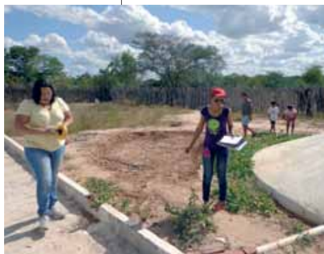
Upanema, Rio Grande do Norte

Para isso, o governo brasileiro organizou um novo desenho institucional com o intuito de enfrentar as raízes do patriarcado, historicamente presente nas políticas públicas. Criou-se a Secretaria de Políticas para Mulheres (SPM), ligada diretamente à Presidência da República, com status de ministério e, no Ministério do Desenvolvimento Agrário (MDA), foi designado um organismo de políticas para mulheres, vinculado à órgão diretivo do ministério – a secretaria executiva. A criação da Diretoria de Políticas para Mulheres Rurais (DPMR) 1 no MDA, com dotação orçamentária e equipe, foi fundamental para alavancar ações de promoção da igualdade no meio rural, reconhecendo-se as mulheres como sujeitos de direito.