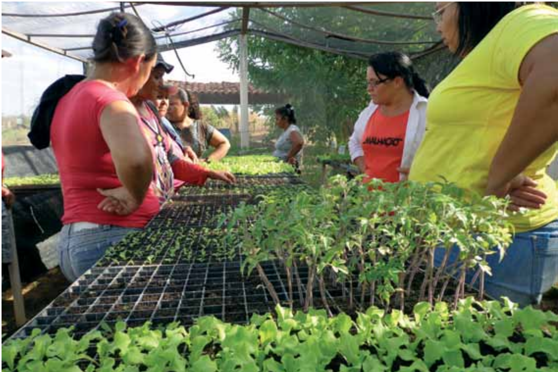
Caraúbas, Rio Grande do Norte

e quais eram os principais obstáculos que elas enfrentavam no acesso às políticas públicas. Com isso, foi possível definir uma linha de base que orientou os passos seguintes do trabalho das equipes. Estratégias desenhadas como a formação de comitês de mulheres nos Colegiados Territoriais foram reafirmadas. Foram também definidos temas e/ou conteúdos a aprofundar no debate em oficinas e seminários.