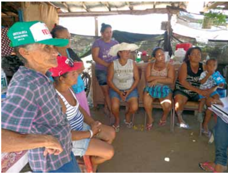
Tibau, Rio Grande do Norte