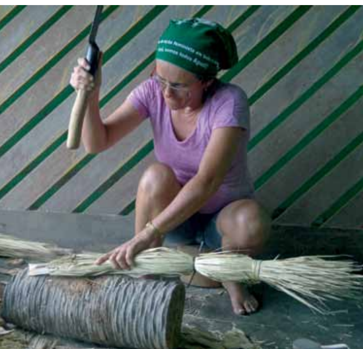
Apodi, Rio Grande do Norte