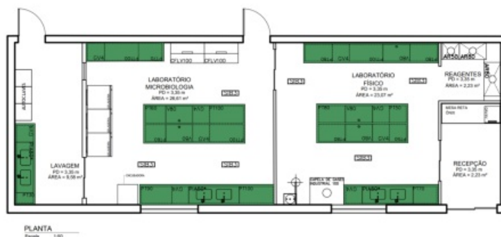
Figura 1. Planta baixa do Laboratório da Qualidade e Meio Ambiente.