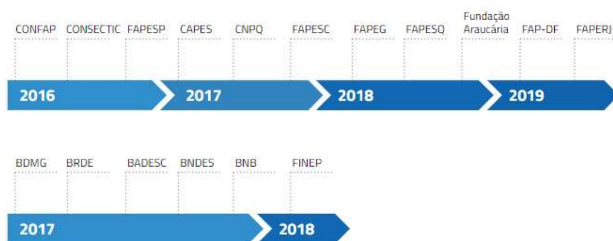
Figura 4 – Cronologia dos acordos com FAPs e bancos regionais

Para o próximo ciclo contratual, a EMBRAPII planeja aprimorar e ampliar as parcerias existentes, incluindo as FAPs dos estados que possuem Unidades EMBRAPII. Outros modelos de parcerias com os estados serão propostos visando reforçar o potencial de pesquisa aplicada de ICTs estaduais que, acolhidas na rede de Unidades EMBRAPII, possibilitem ampliar o conjunto de ecossistemas de inovação no nível estadual.