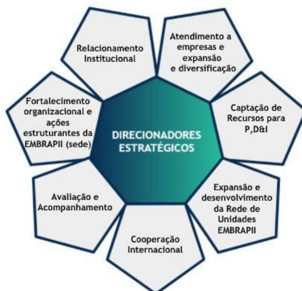
Figura 2 – Quadro de direcionadores estratégicos

Em virtude dos seus resultados, da conjuntura econômica, e da comprovada importância da inovação tecnológica na competitividade do país, a EMBRAPPII considera que tem relevantes desafios e excelentes perspectivas para os seus próximos 10 anos. Os direcionadores estratégicos são detalhados a seguir.