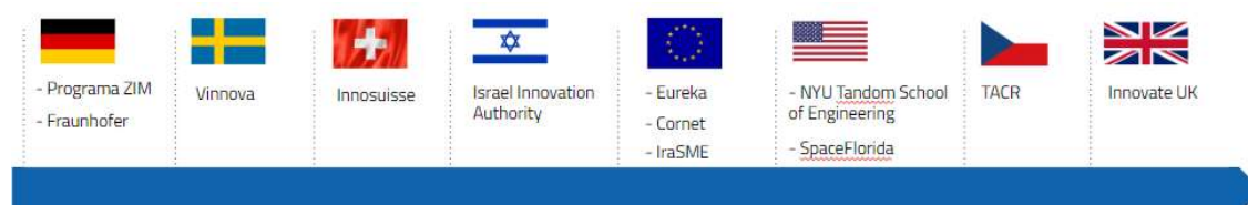
Figura 5 – Parcerias Internacionais

No próximo ciclo contratual, a EMBRAPPII continuará a ampliar as oportunidades de cooperação internacional visando atender à crescente demanda internacional e brasileira para explorar as diversas possibilidades oferecidas no manejo das vantagens competitivas e comparativas disponíveis.