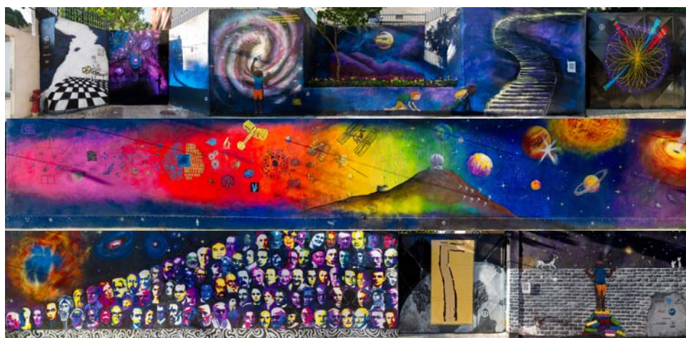
Nas três fileiras, visão geral das oito áreas do Mural-Graffiti da Ciência, do CBPF