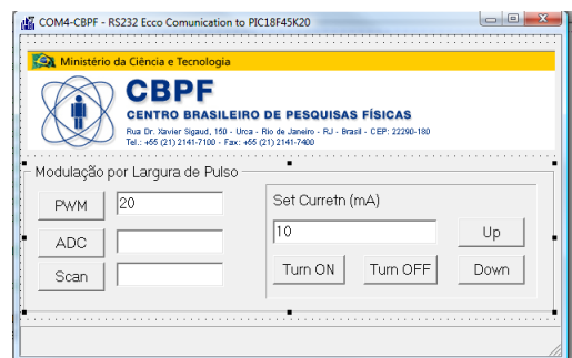
Figura 1 – Operação laser CPS180 conectado ao circuito eletrônico responsável por controlar a corrente elétrica do laser e interface visual do programa.