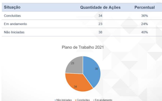
Figura 3 – Resultado do Plano de Trabalho do PDTIC 2021-2023 – ano 2021.

Departamento de Tecnologia da Informação