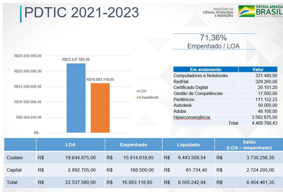
Tabela 2 – Resultado da avaliação orçamentária do ano de 2021.

Em relação à avaliação orçamentária para os anos de 2020 e 2021, o resultado obtido é apresentado na Tabela 2.