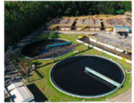
Estação de tratamento de esgoto da Copasa, estatal mineira de saneamento. Inovação/Case

SÃO PAULO O posto de investidor de referência da Copasa, estatal mineira de saneamento, será disputado pela Equatorial e por um consórcio formado pela Aegea e seus acionistas. Equipar, GIC (Grupo soberano de Singapura) e Itaú. A informação foi antecipada pelo jornal Valor Econômico e confirmada pela Aegea. As propostas foram entregues na segunda (25) e incluem o valor por ação que cada grupo está disposto a pagar para arrematar 30% da companhia. O finalista —que o Governo de Minas Gerais deve anunciar nesta quarta (27)— será quem tiver oferecido o maior preço.