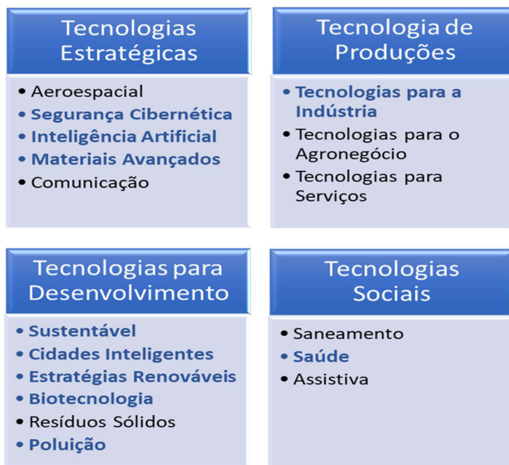
Figura 3 – Áreas estratégicas do MCTI desenvolvidas no LNCC.

Alinhando-se ao Planejamento Estratégico do Governo Federal e do MCTI, a equipe de pesquisadores do LNCC desenvolve pesquisas fundamentais e aplicadas nas áreas grifadas na Figura 3.