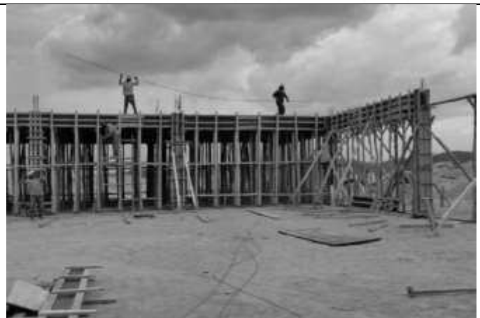
Posicionamento de fôrmas das vigas.