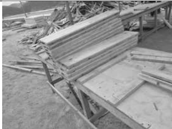
Confecção das fôrmas dos pilares.