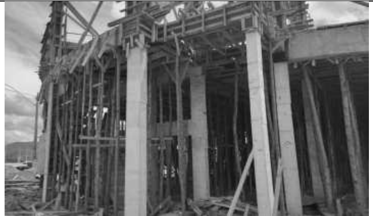
Retirada de fôrmas dos pilares do pavimento térreo.