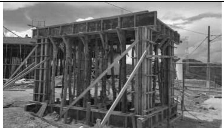
Retirada de fôrmas das vigas e pilares da guarita.