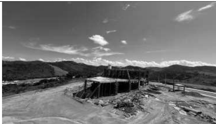
Vista superior da obra.