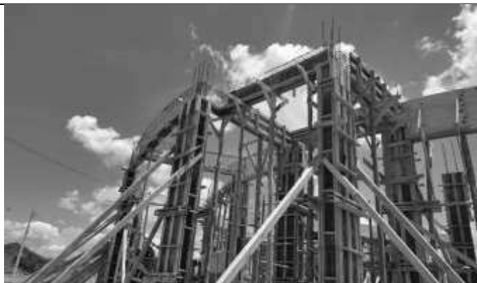
Posicionamento de armação das vigas.