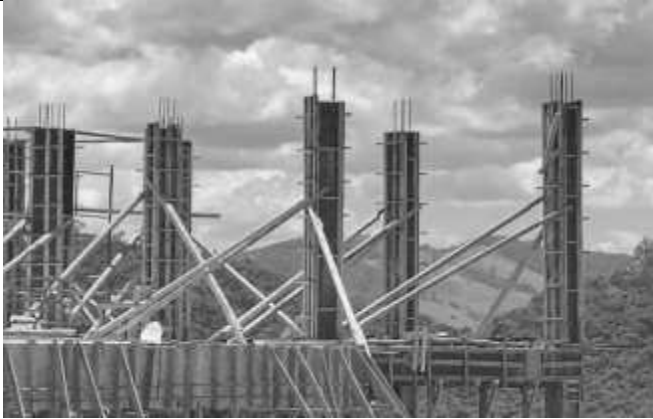
Execução das fôrmas para pilares no segundo pavimento.