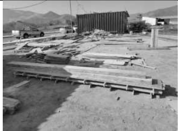
Confecção das fôrmas dos pilares.