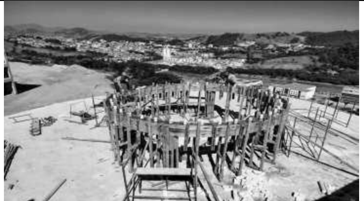
Preparação e concretagem das vigas do observatório.