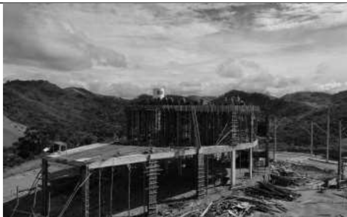
Posicionamento das fôrmas da laje do primeiro pavimento.