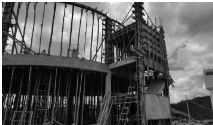
Posicionamento das fôrmas das escadas.