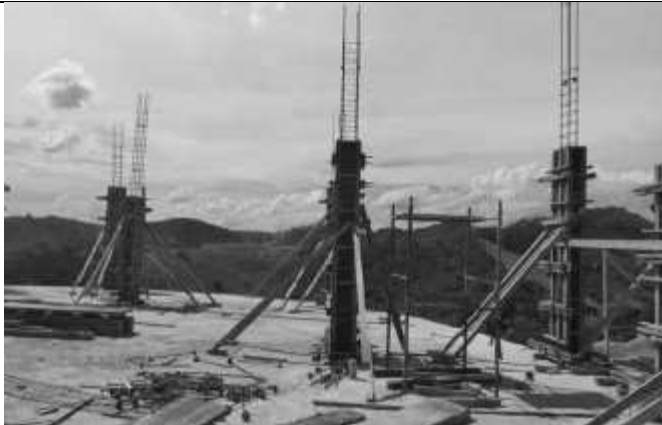
Posicionamento das fôrmas dos pilares do primeiro pavimento.