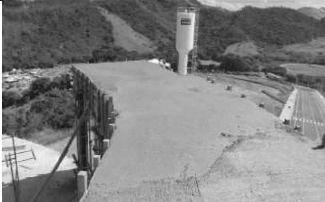
Concretagem da laje da escada e elevador do segundo pavimento.