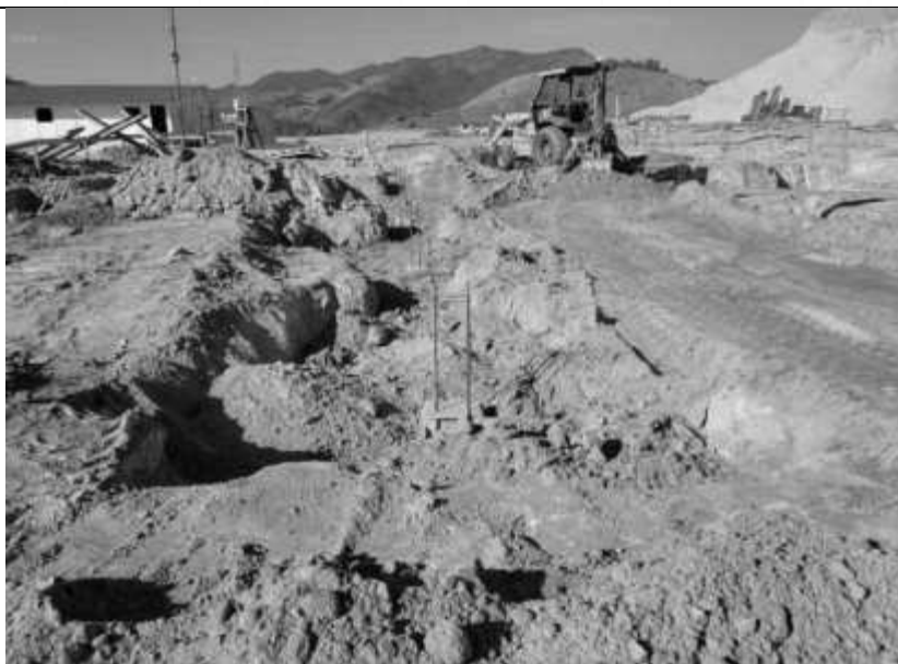
Reaterro de vala para execução de viga baldrames