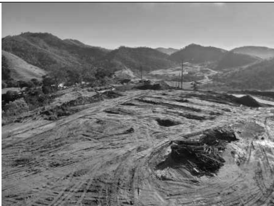
Vista das perfurações das estacas.