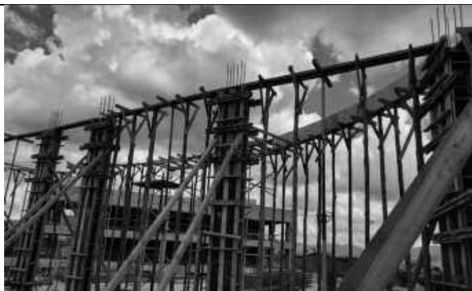
Posicionamento das escoras e fundo de vigas do primeiro pavimento.