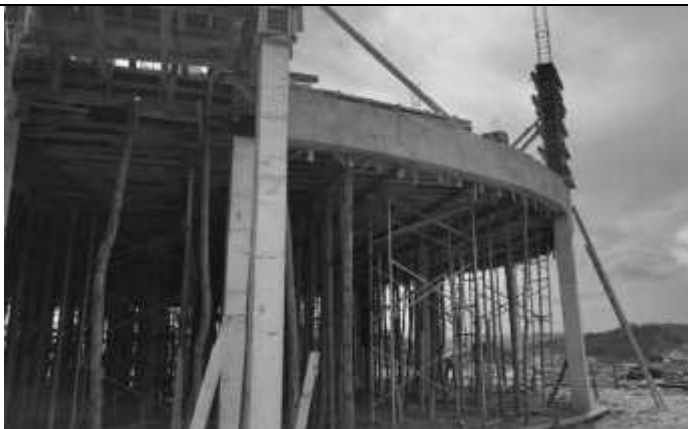
Retirada das fôrmas das vigas do pavimento térreo.