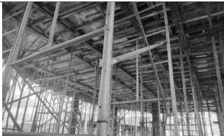
Escoramento da laje do primeiro pavimento.