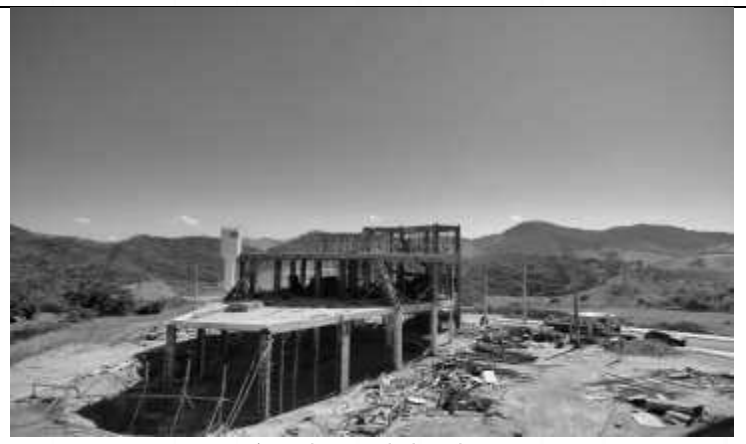
Vista lateral da obra.