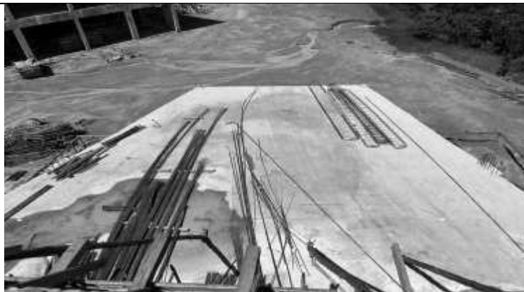
Ferragens utilizadas na obra.