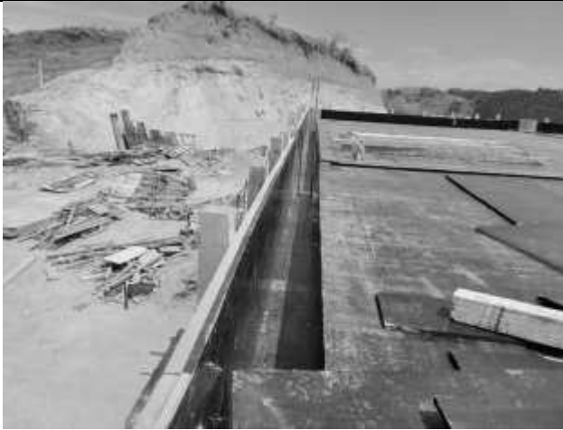
Posicionamento do fundo da laje.