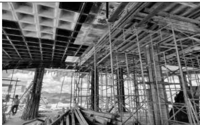
Retiradas de fôrmas e escoras da laje do primeiro pavimento.