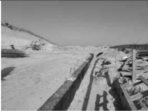
Impermeabilização das vigas baldrames superiores.