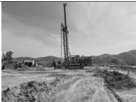
Armação de ferragem para estaca.