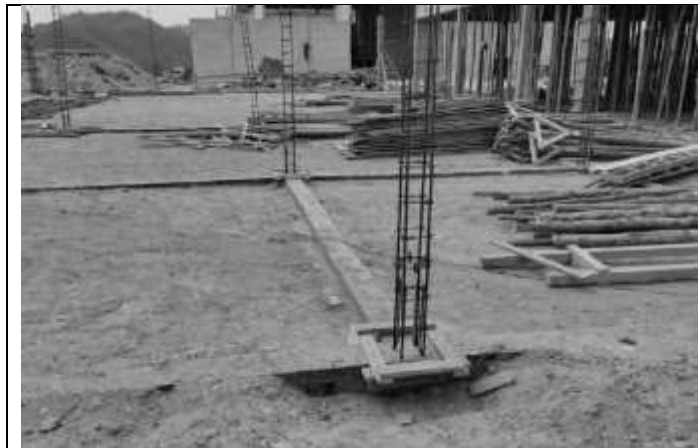
Posicionamento das ferragens dos pilares.