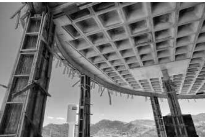
Desforma da laje e vigas do primeiro pavimento.