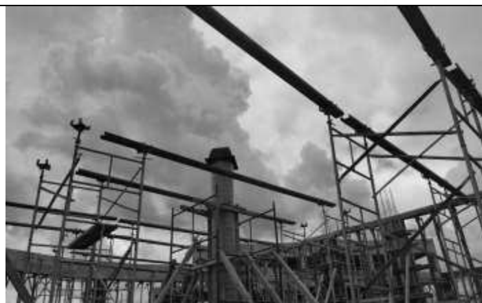
Posicionamento das escoras para formas da laje.