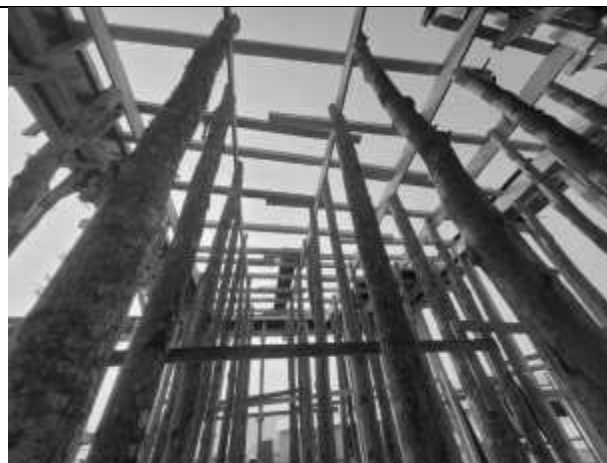
Posicionamento das escoras de madeira da laje.

DATA DA VISTORIA: 17/09/2024 - 24/09/2024 - 25/09/2024