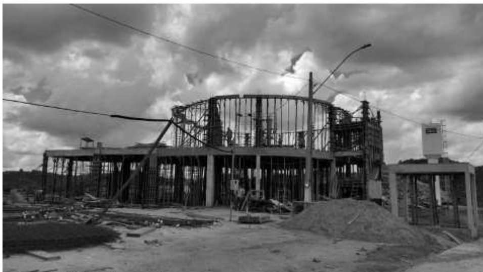
Vista lateral da obra.