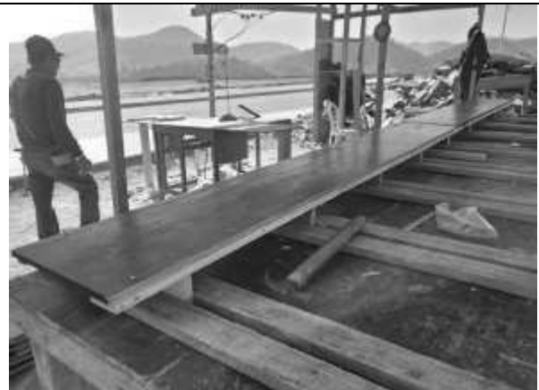
Confecção das fôrmas das vigas.