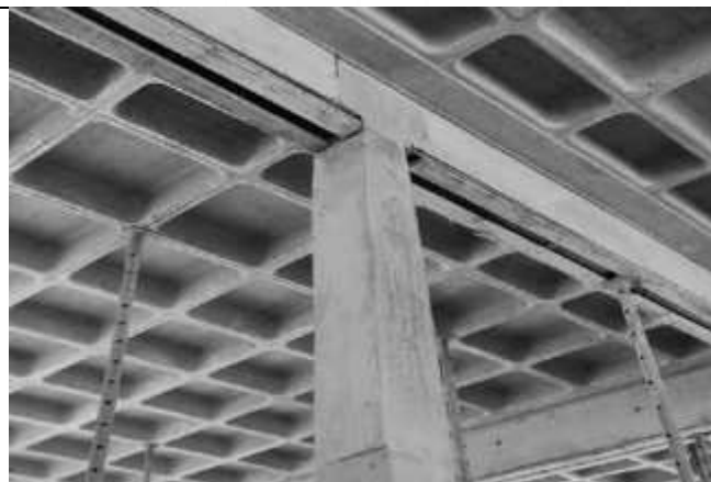
Posicionamento das fôrmas dos pilares.