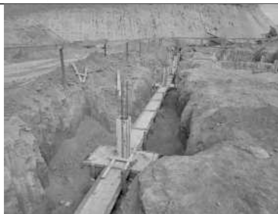
Posicionamento das fôrmas dos pilares.