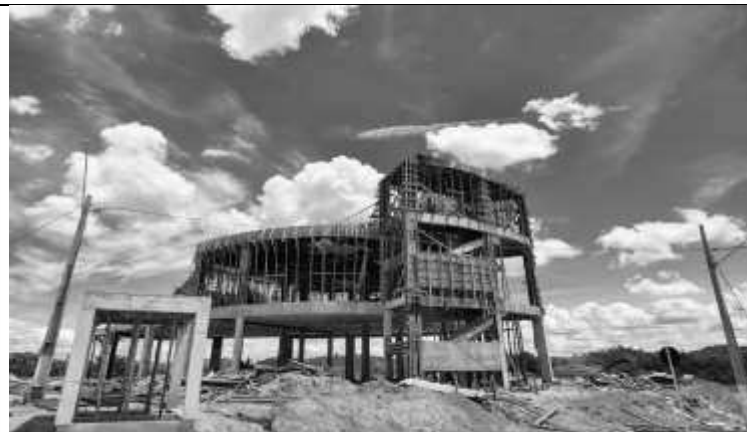
Vista lateral da obra.