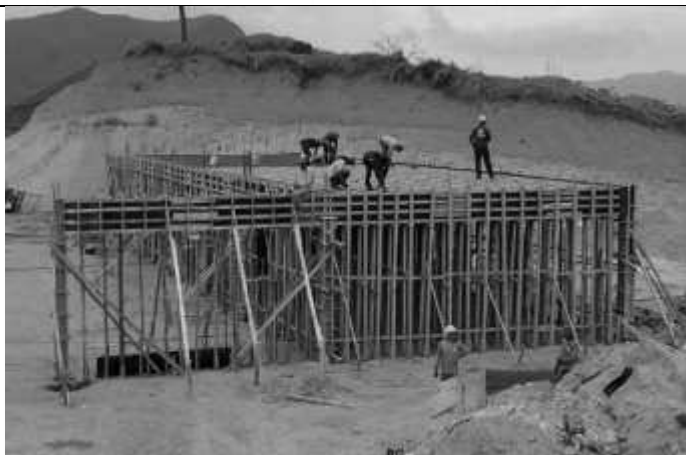
Posicionamento de ferragens na laje.