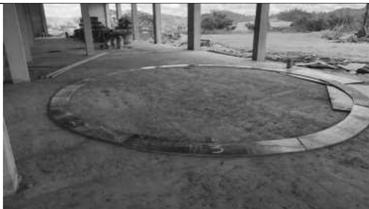
Execução de gabarito para o observatório.