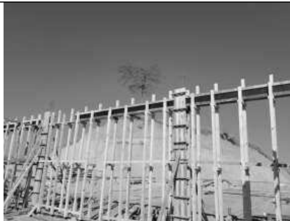
Posicionamento das fôrmas das vigas.