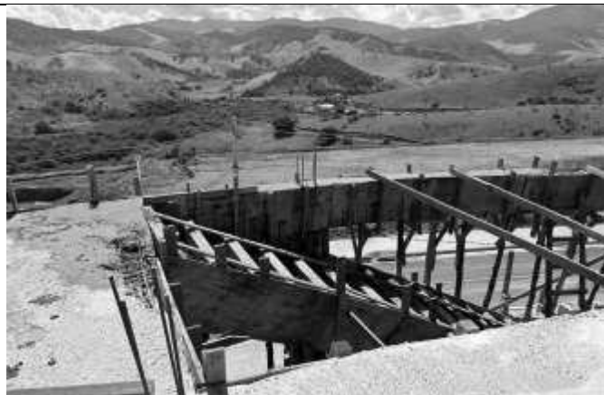
Execução de fôrma da escada do segundo pavimento.