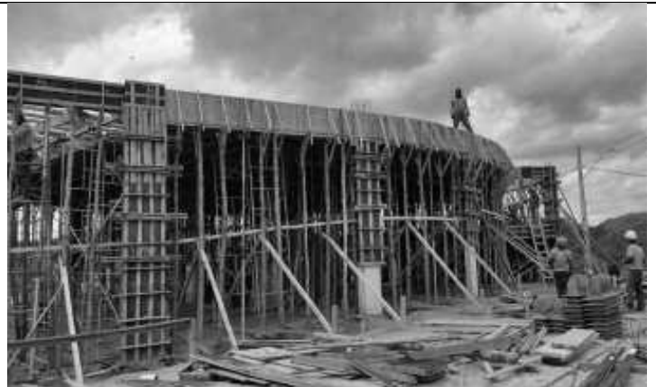
Concretagem da laje.