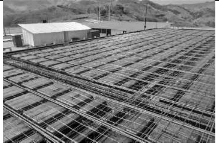
Posicionamento de ferragem da laje.