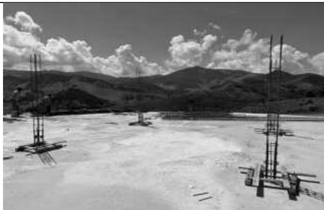
Execução de ferragens para pilares no segundo pavimento.