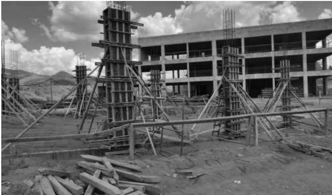
Posicionamento das fôrmas dos pilares.