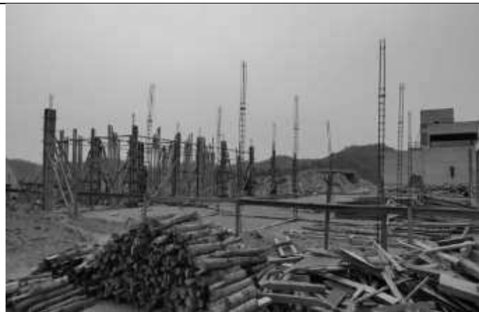
Posicionamento das fôrmas dos pilares.