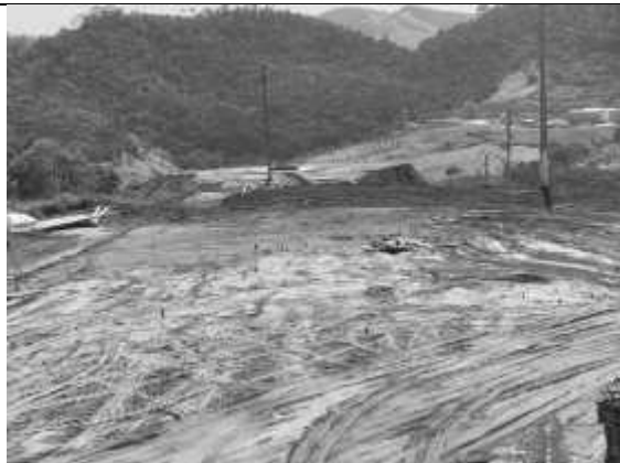
Locação das estacas