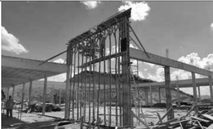
Posicionamento das ferragens e formas de vigas e pilares.