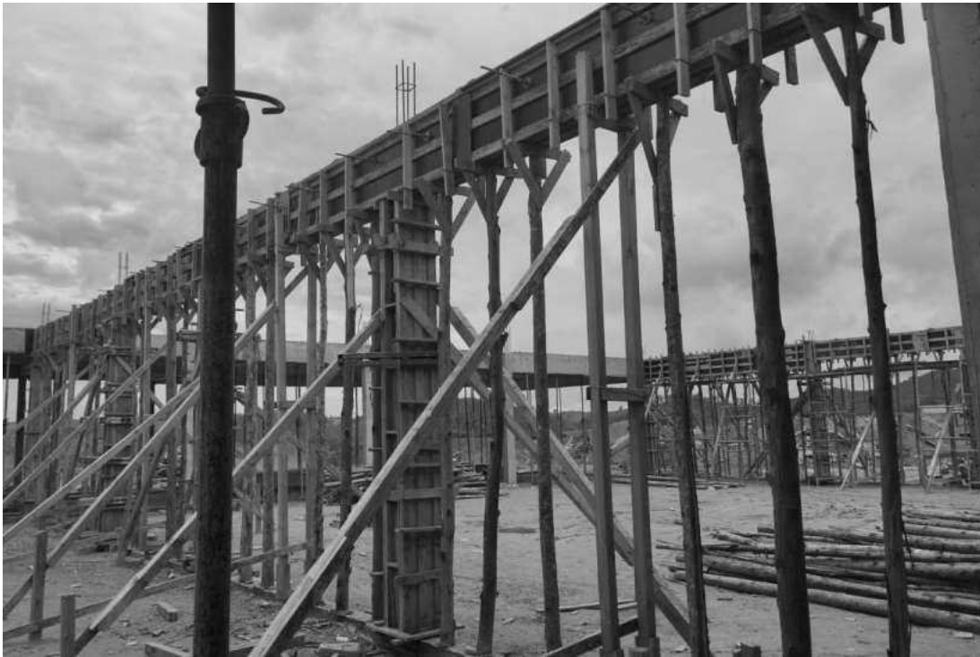
Concretagem de vigas.