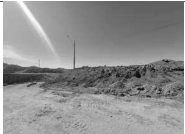
Locação das estacas.