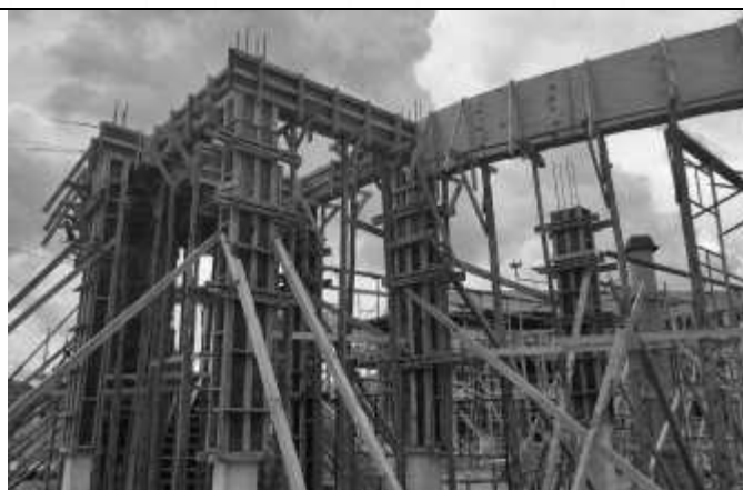
Posicionamento de formas de vigas.