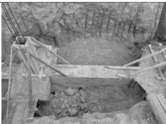
Desforma dos blocos de coroamento e vigas baldrame.