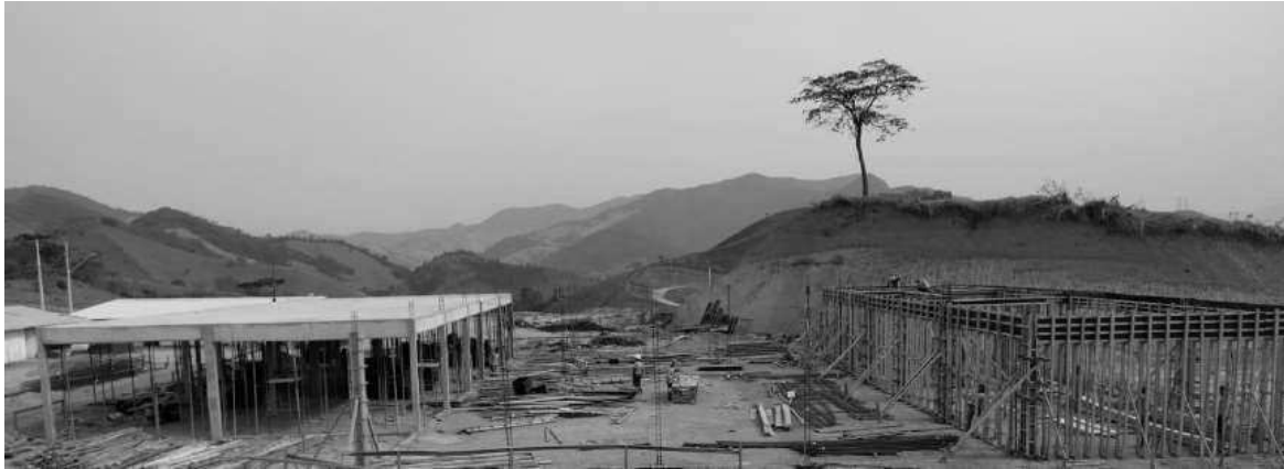
Vista superior da obra