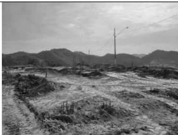
Armaduras expostas das estacas do pilar P15.