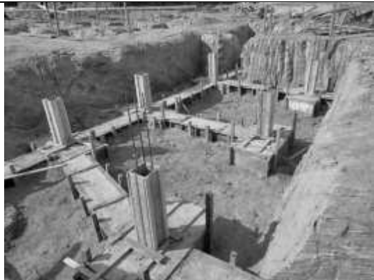
Posicionamento das fôrmas e ferragens dos pilares.