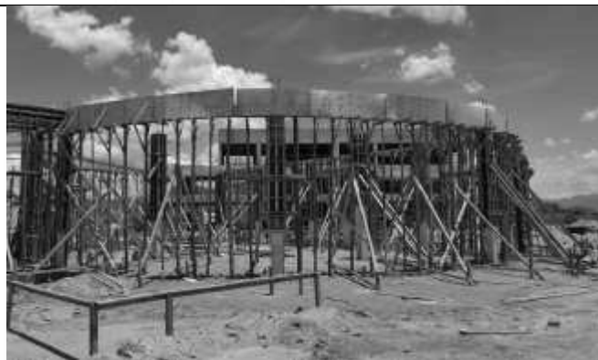
Vista lateral da obra