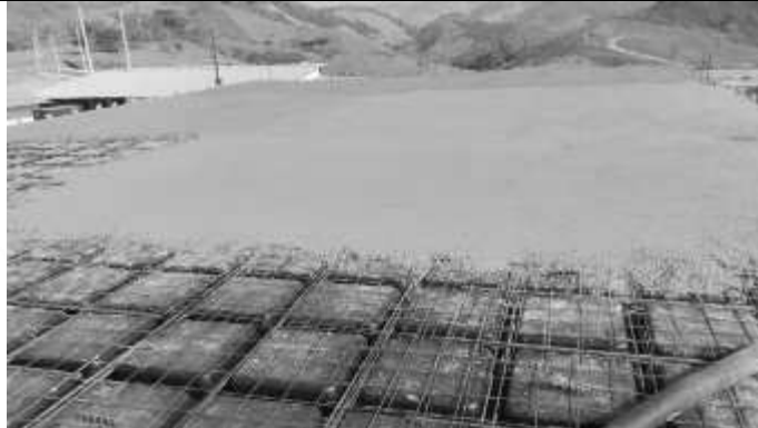
Concretagem da laje.