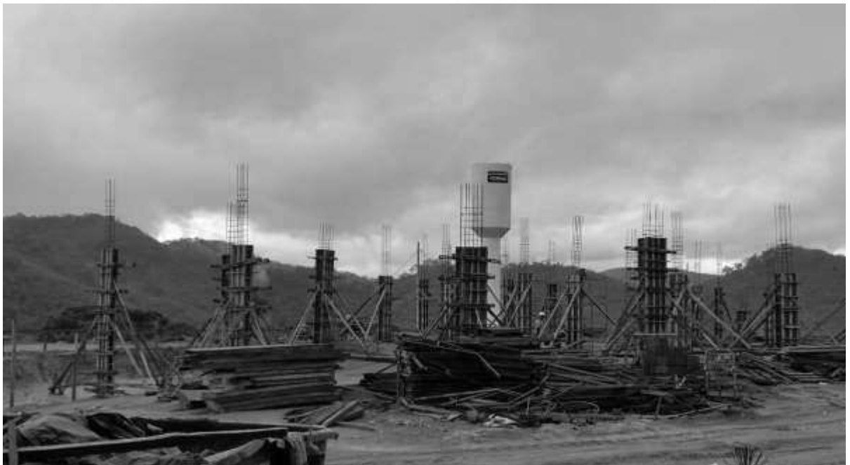
Enchimento das fôrmas dos pilares.