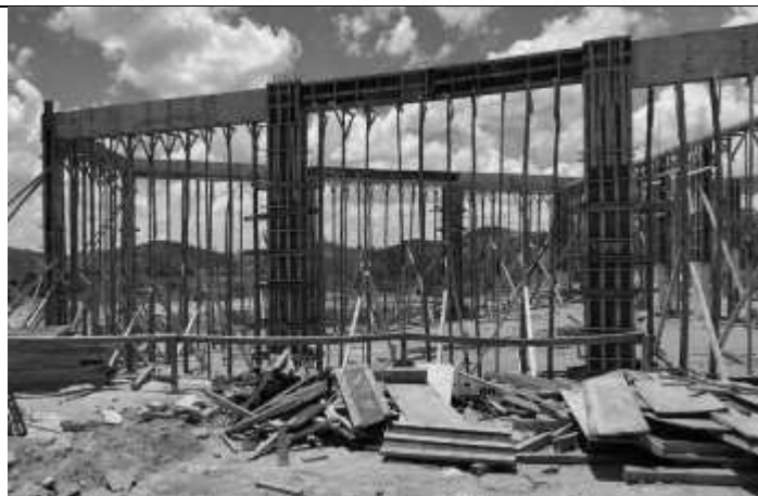
Execução de formas para vigas.