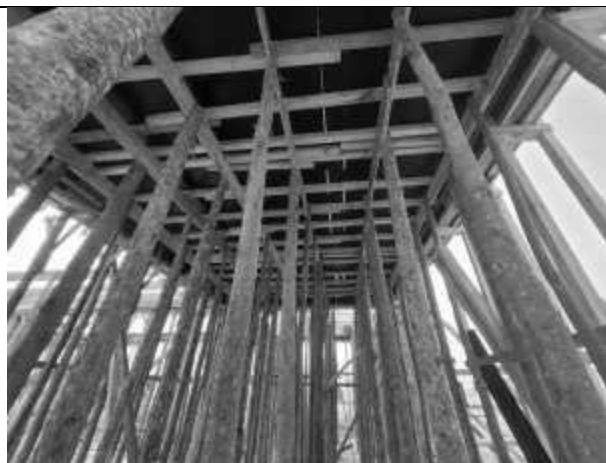
Posicionamento das escoras de madeira da laje.