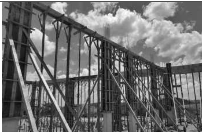
Abertura de pilar para posicionamento de escora de madeira das vigas.