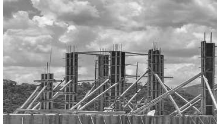
Posicionamento de escoras de madeira para fôrmas das vigas.