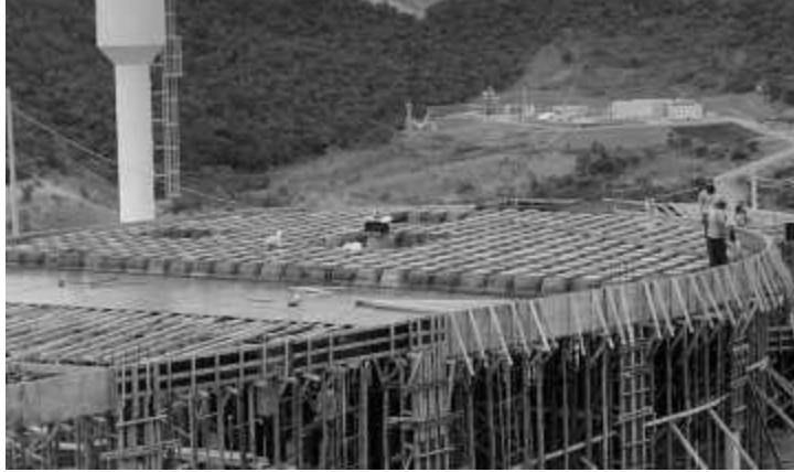
Posicionamento das fôrmas da laje nervurada.