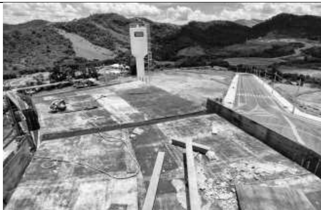
Execução de fôrma da laje da escada e elevador.