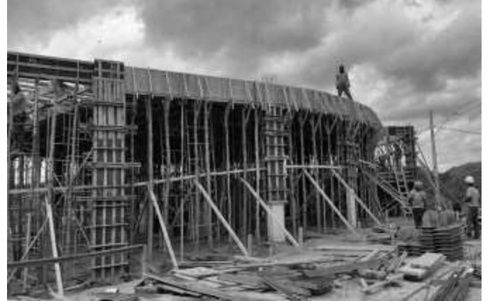
Posicionamento de escoras da fôrma da laje.

DATA DA VISTORIA: 18/12/2024 – 19/12/2024