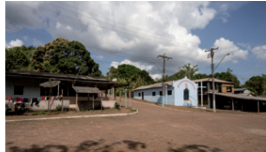
Carmo do Maruanum