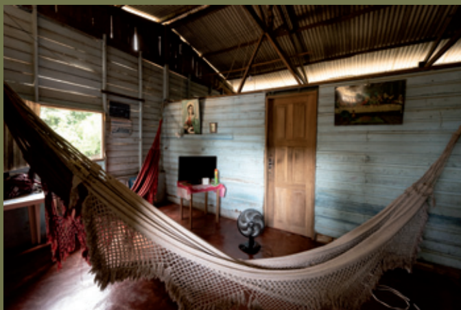
Detalhes da sala e cozinha de Marciana | Santa Luzia do Marauanum