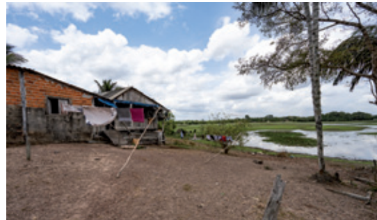
Torrão do Maruanum