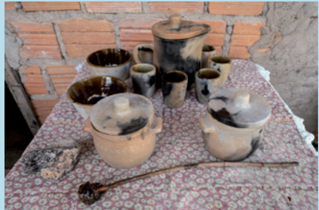
Louças de Mundoca | Santa Luzia do Maruanum