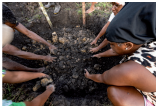
Grupo cavando o buraco para retirada do barro | Santo Antonio do Maruanum