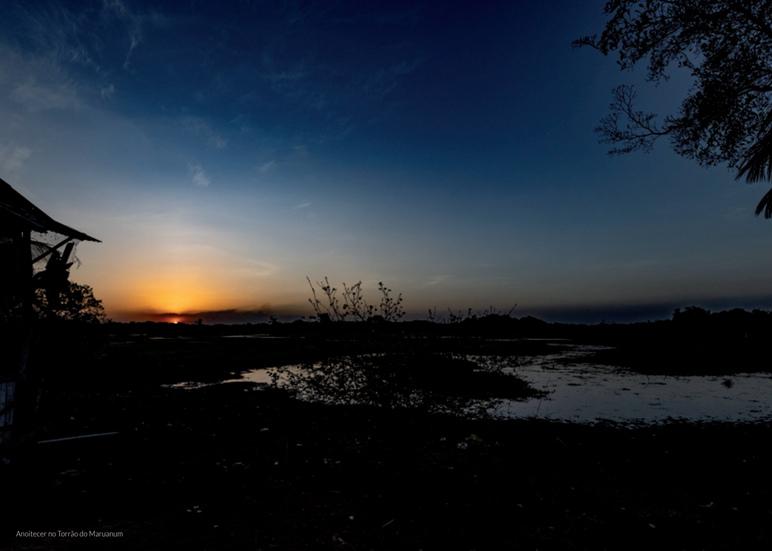
Anoitecer no Torrão do Maruanum