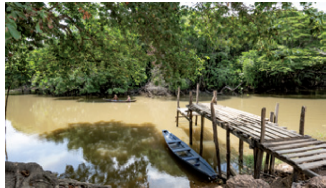
Rio Maruanum | Santa Luzia do Maruanum