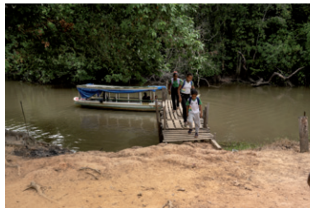
Barco escolar | Santa Luzia do Maruanum

cemitério e as sedes do Rurap (Instituto de Extensão, Assistência e Desenvolvimento Rural do Amapá), da Caesa (Companhia de Água e Esgoto do Amapá), da CEA (Companhia de Eletricidade do Amapá) e do posto policial. Na vila do Carmo, há pequenos comércios e alguns restaurantes e bares. As compras de supermercado e farmácia são feitas em Macapá. O transporte de alunos para as escolas é realizado por lanchas e kombis.