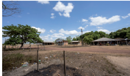
São João do Maruanum II