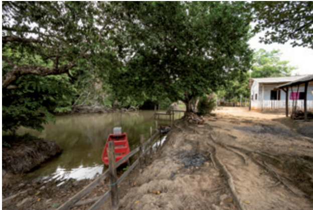
Santa Luzia do Maruanum

o número varia sempre em torno de 20, considerando o falecimento de algumas delas e o início da atividade por crianças e jovens. A descrição da comunidade e do modo de fazer permanece bastante semelhante. Em relação à circulação, expandiu-se o circuito de vendas para Macapá, com experiências pontuais em outros estados; foram realizados projetos que inseriram novos modelos de louças; o ofício foi divulgado pela imprensa, por publicações acadêmicas e por exposições; e o contato e a atuação de pesquisadores e instituições se intensificaram.