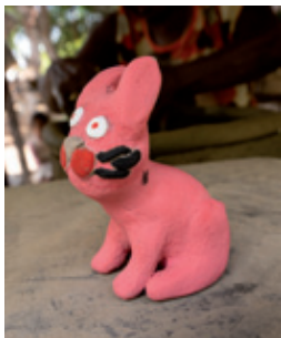
Bichinho de barro.