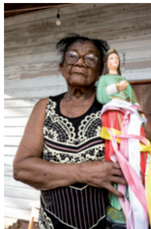
Marciana e a imagem de Santa Luzia | Santa Luzia do Maruanum

A louça do Maruanum é divulgada na mídia local 5 , estudada por pesquisadores de universidades/institutos do Amapá e exibida em exposições locais 6 . Há uma série de trabalhos acadêmicos produzidos