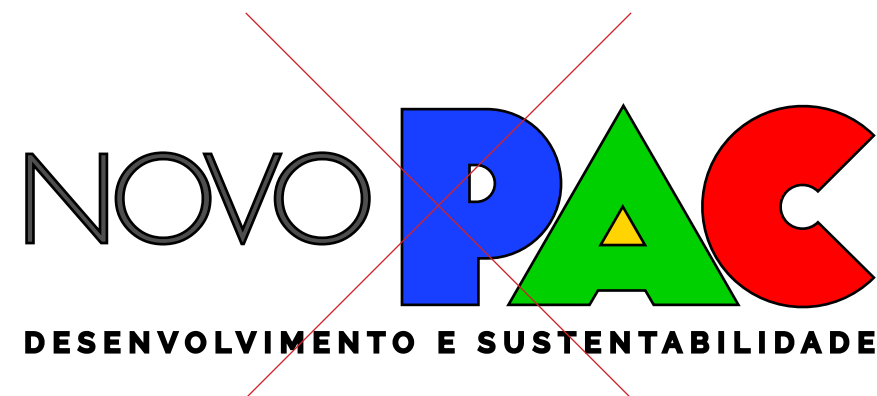
Não aplicar outlines