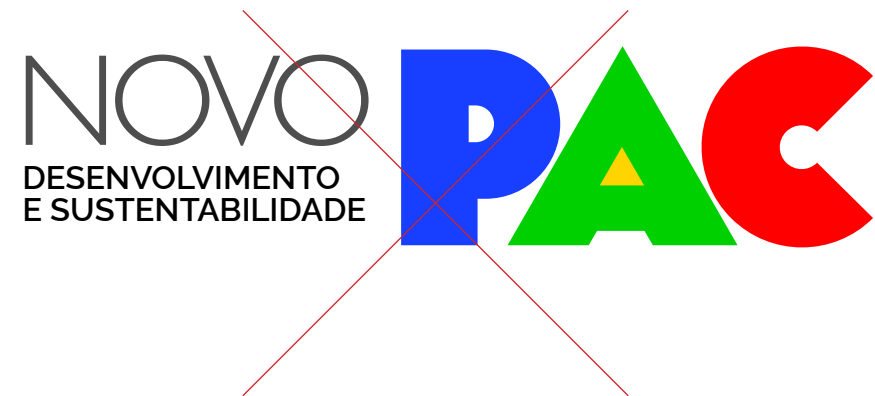
Não alterar alinhamento