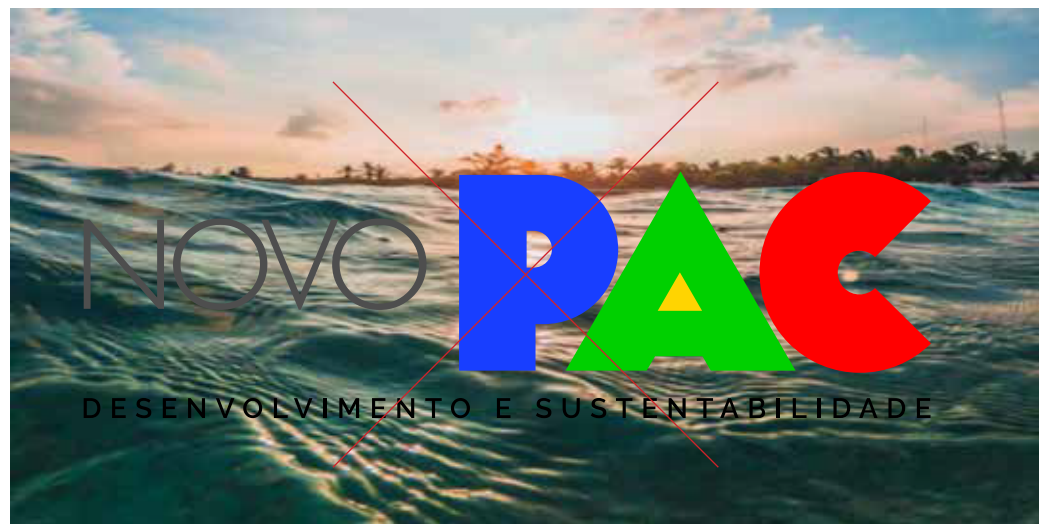
Não aplicar diretamente sobre fotos