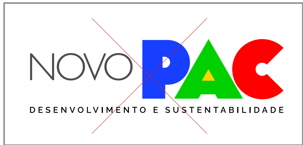
Não aplicar molduras