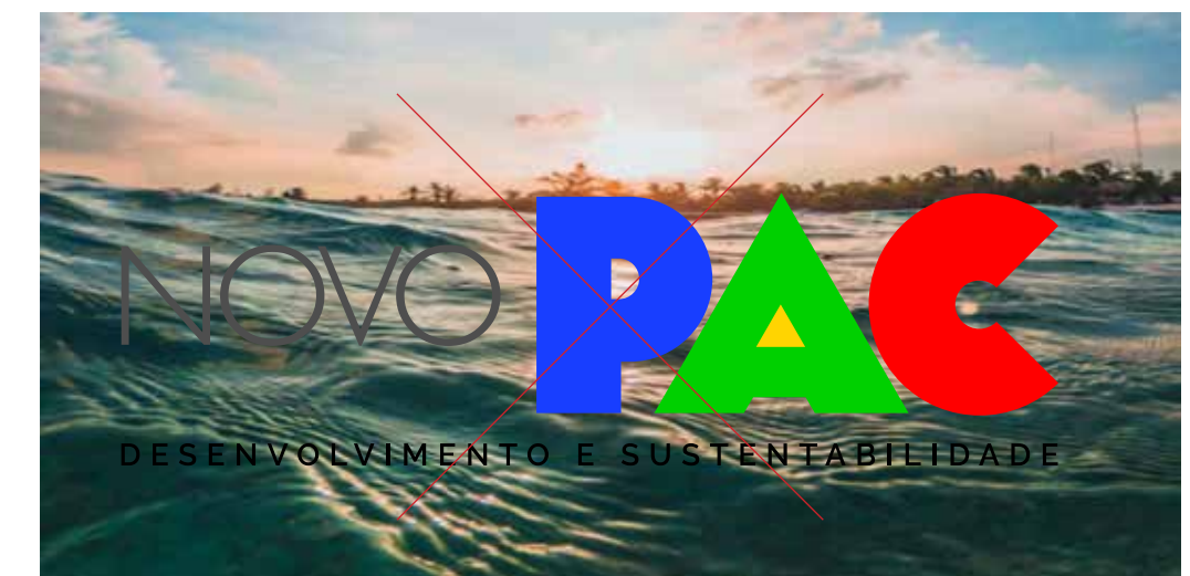
Não aplicar diretamente sobre fotos