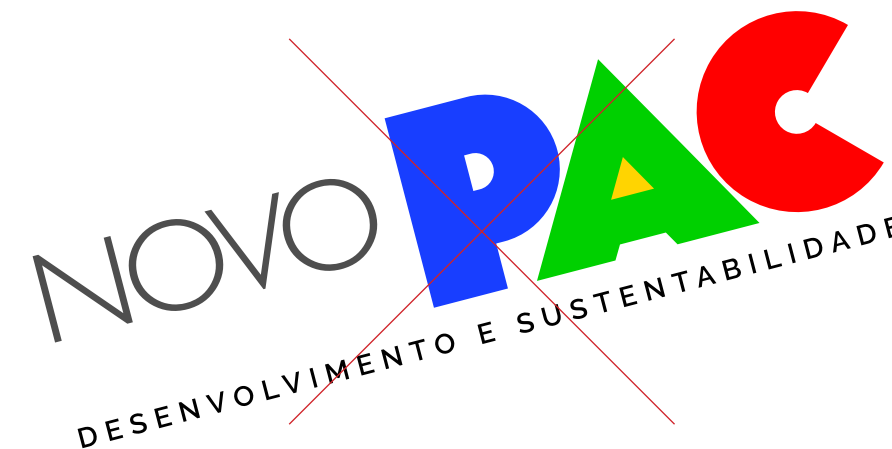
Não inclinar o selo