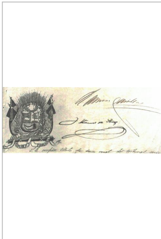
Imágen: Sello calcográfico y autógrafas