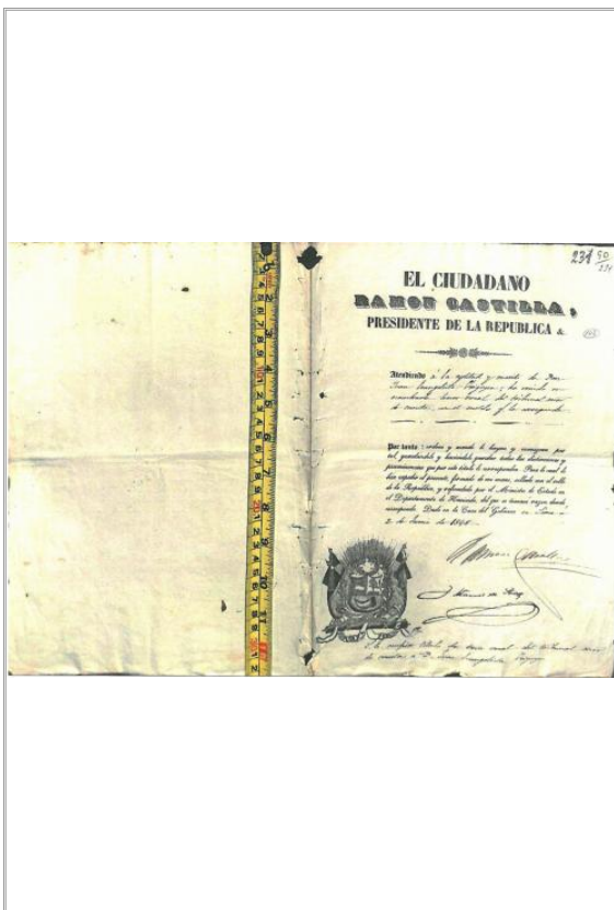
Imágen: Vista Anterior