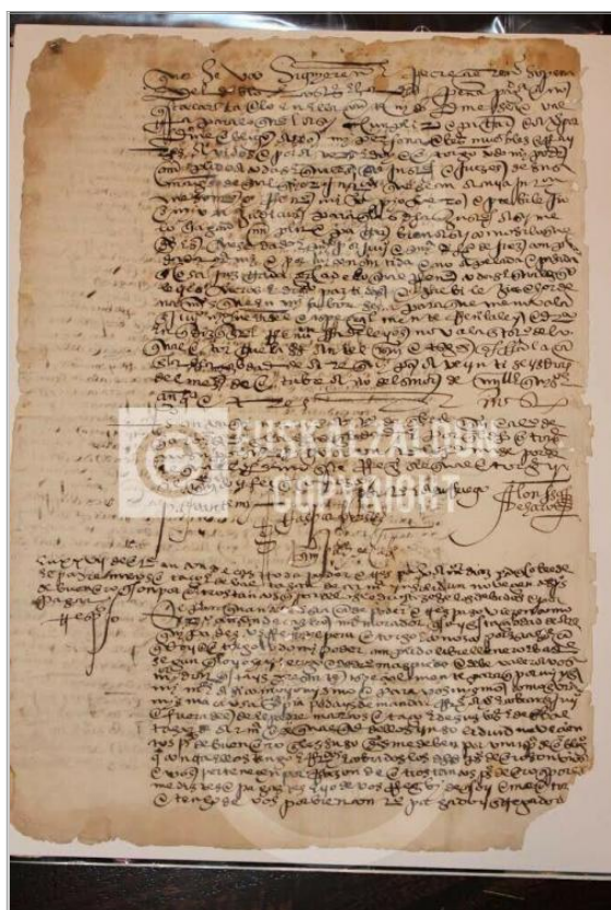
Imágen: Vista Posterior