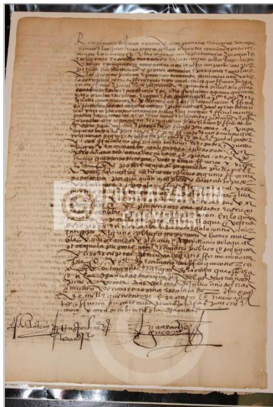
Imágen: Vista Posterior