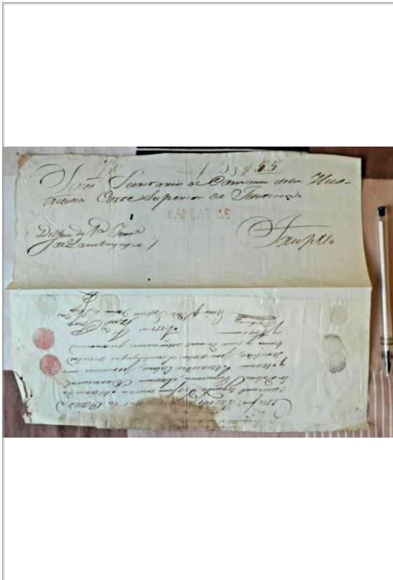
Imágen: Vista General