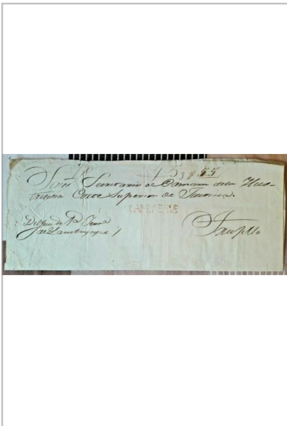
Imágen: Vista Superior