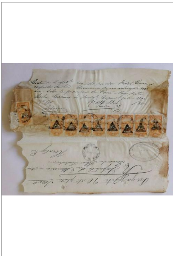
Imágen: Vista General