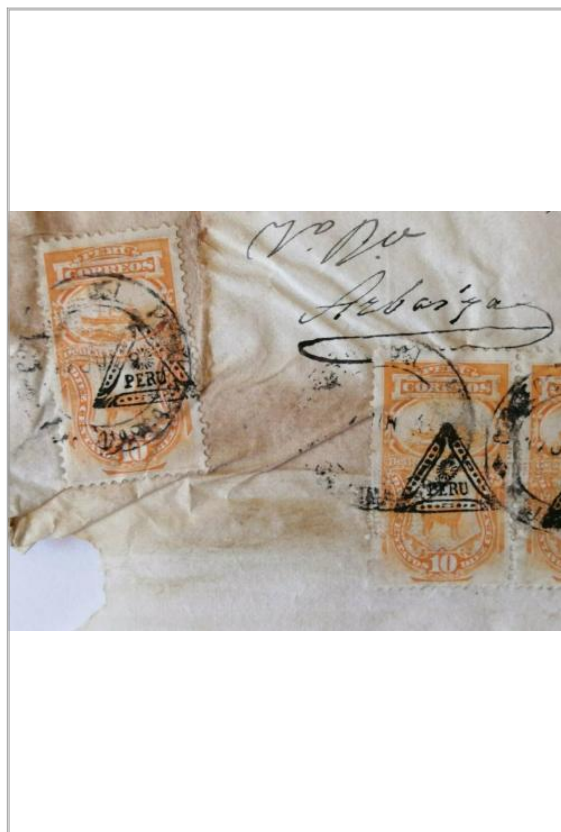
Imágen: Vista Detalle 3