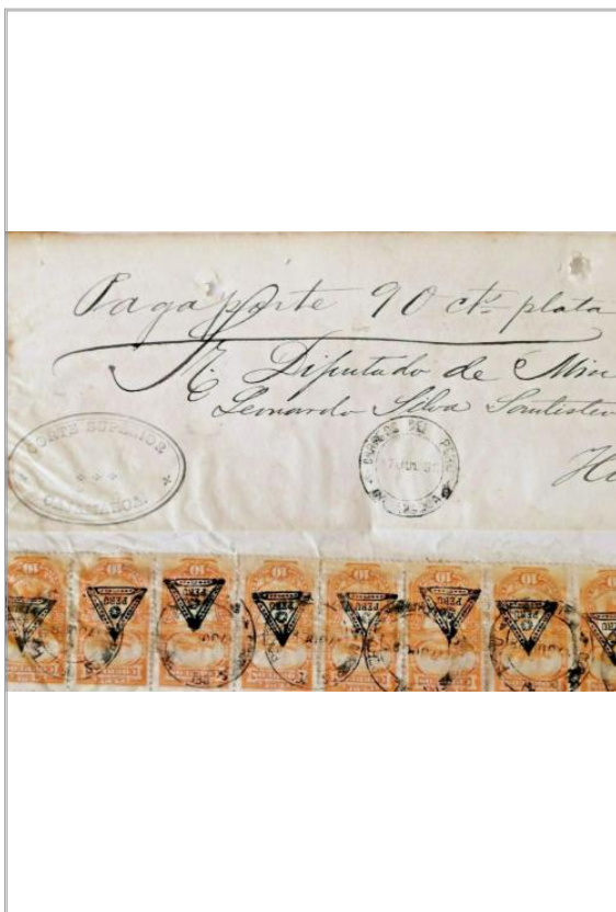
Imágen: Vista Detalle 2