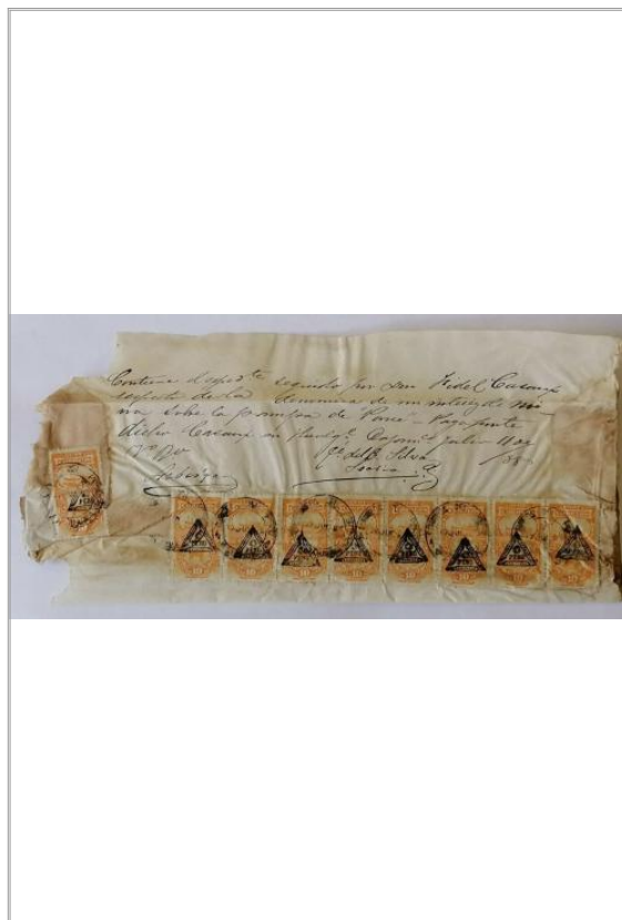
Imágen: Vista Detalle 1