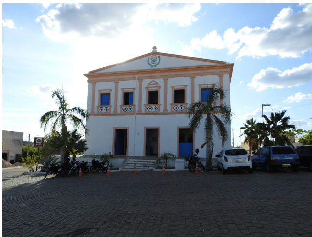
Figura 04: Casa de Câmara e Cadeia de Acari. Autor: Ivanildo Soares da Silva, 2024. Fonte: Acervo do Iphan/RN.

[...] seguindo um modelo arquitetônico neoclássico, com uma fachada simétrica, um frontão triangular e o brasão do império central. Sua fachada foi inspirada na arquitetura neoclássica. Pedra e tijolos foram os materiais usados nas paredes, denotando maior apuro técnico-construtivo, estilístico e melhoria no setor da construção civil. Na fase final da construção do edifício, por volta de 1885, foi contratado um arquiteto, Paulino José de Maria, pela Câmara para trabalhar na obra. Podemos supor que foi o encarregado de conceber a fachada do prédio.