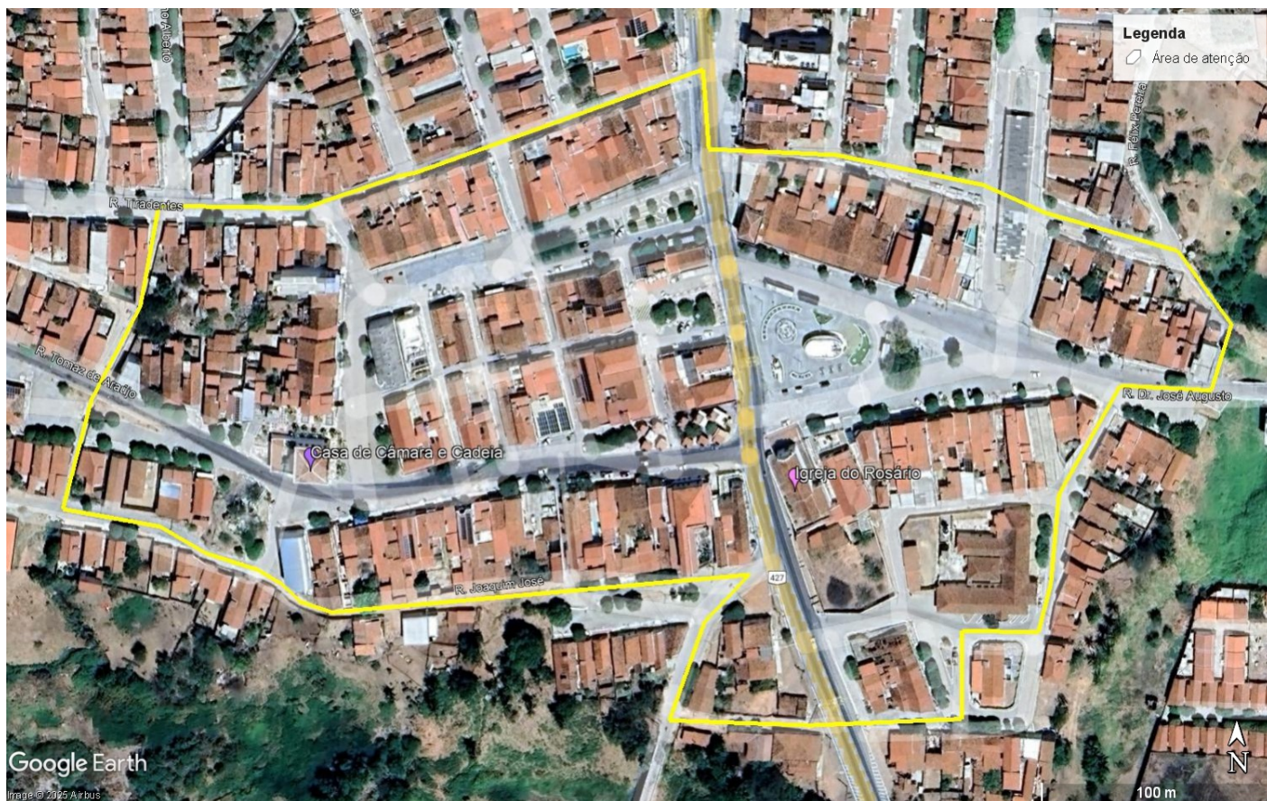
Figura 05: Área de atenção do Iphan no entorno dos bens tombados em Acari. Autoras: Maria Helena Soares e Diana Barbosa.