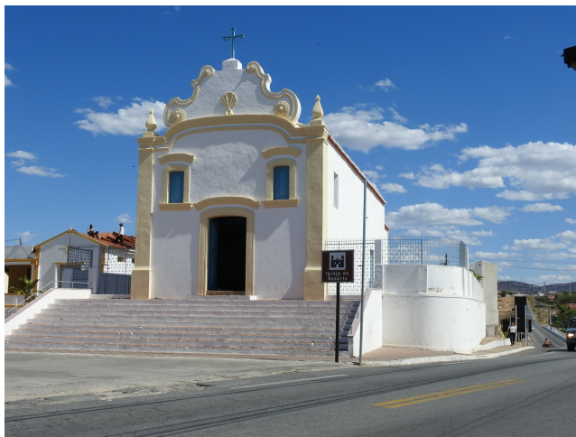
Figura 03: Igreja de Nossa Senhora do Rosário, primeira igreja de Acari. Bem tombado pelo Iphan.

Na sua quase totalidade, as imagens abrigadas nessa igreja remontam ao século XVIII. (Grifo nosso).