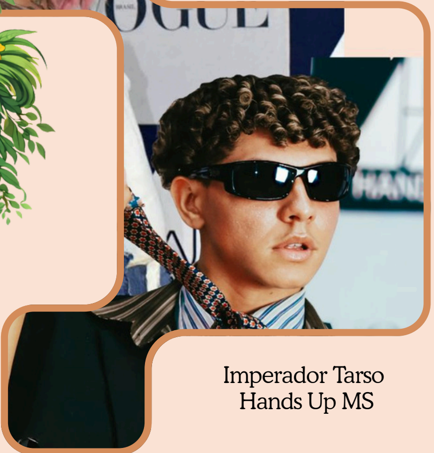
Imperador Tarso Hands Up MS