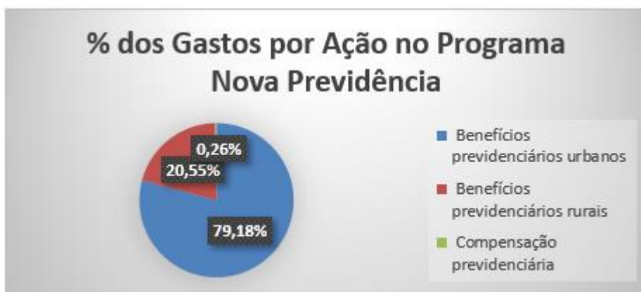
Gráfico - 3 - Percentual de Particip. Gastos – Ações Realizadas Progr. Prev. Social

Observa-se no Gráfico 3 que os gastos na ação “Benefícios Previdenciários Urbanos” representam 79,18% do total dos gastos no programas “Nova Previdência”, no 1º Trimestre do Exercício Financeiro de 2021.