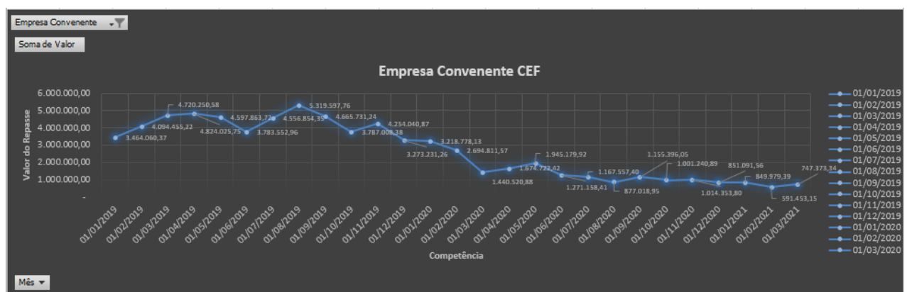
Gráfico 2 - Repasse de Recursos à Empresa Convênente - CEF