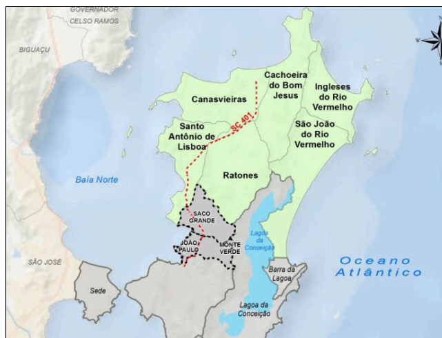
Figura 02 - Distribuição das agências da Grande Florianópolis

2.10. Cabe ainda destacar que a região Norte de Florianópolis tende a crescer mais do que as regiões Leste e Sul. A SC-401 atualmente é chamada por muitos de o “novo corredor econômico”, “rodovia da inovação”, ou mesmo “novo corredor do polo tecnológico”. O que se explica pelo aumento no número de empresas de tecnologias que estão indo, e se instalando ao longo dessa via, assim como outros setores comerciais, até mesmo o centro Administrativo do Estado de Santa Catarina. Esse aumento é justificado por muitos comerciantes como uma alternativa hoje mais viável, já que o centro de Florianópolis tem hoje o m 2 mais caro, além da questão da falta de mobilidade urbana como também, a dificuldade de estacionamento.