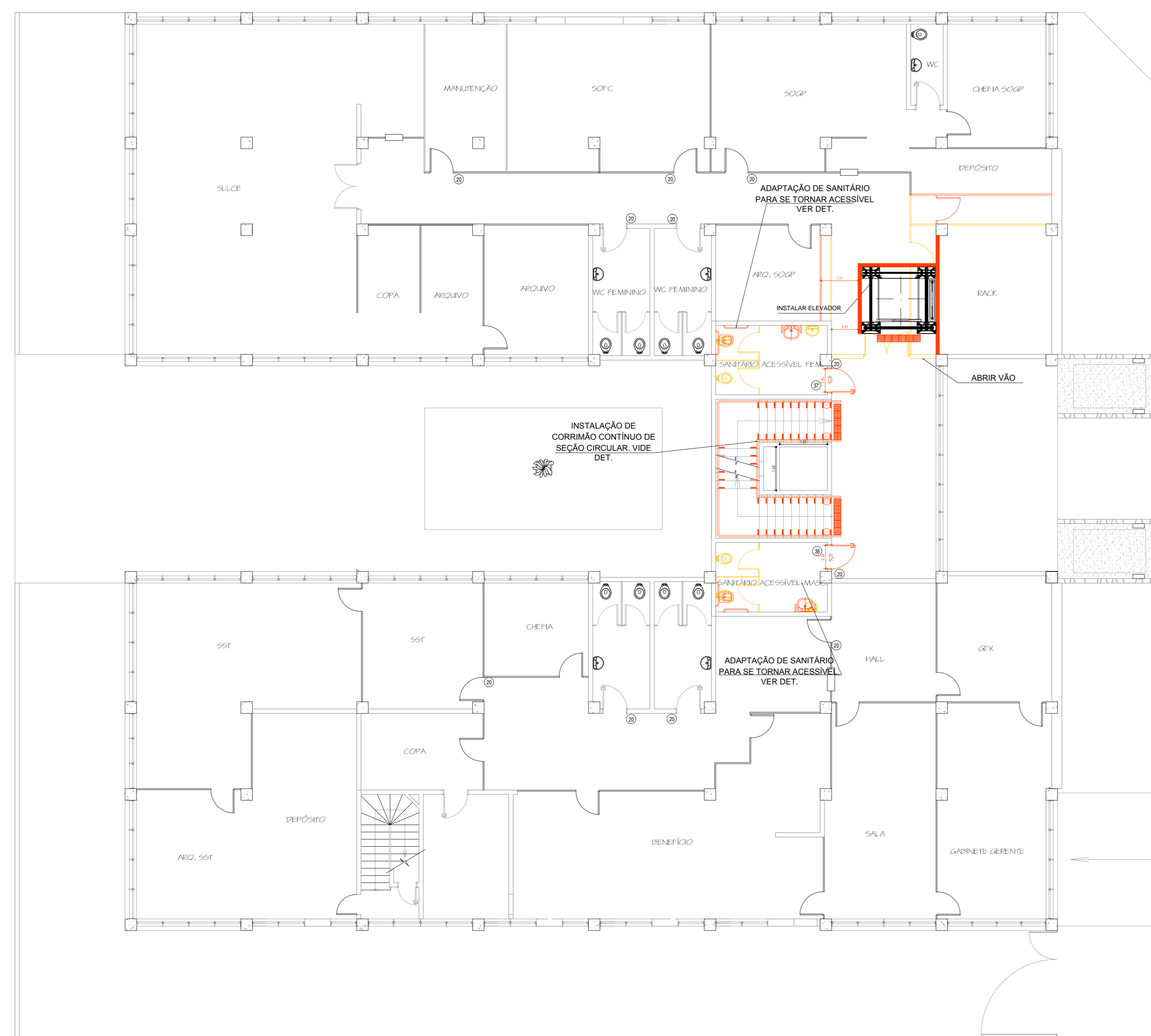
PLANTA BAIXA - Esc.: 1:100 1º ANDAR