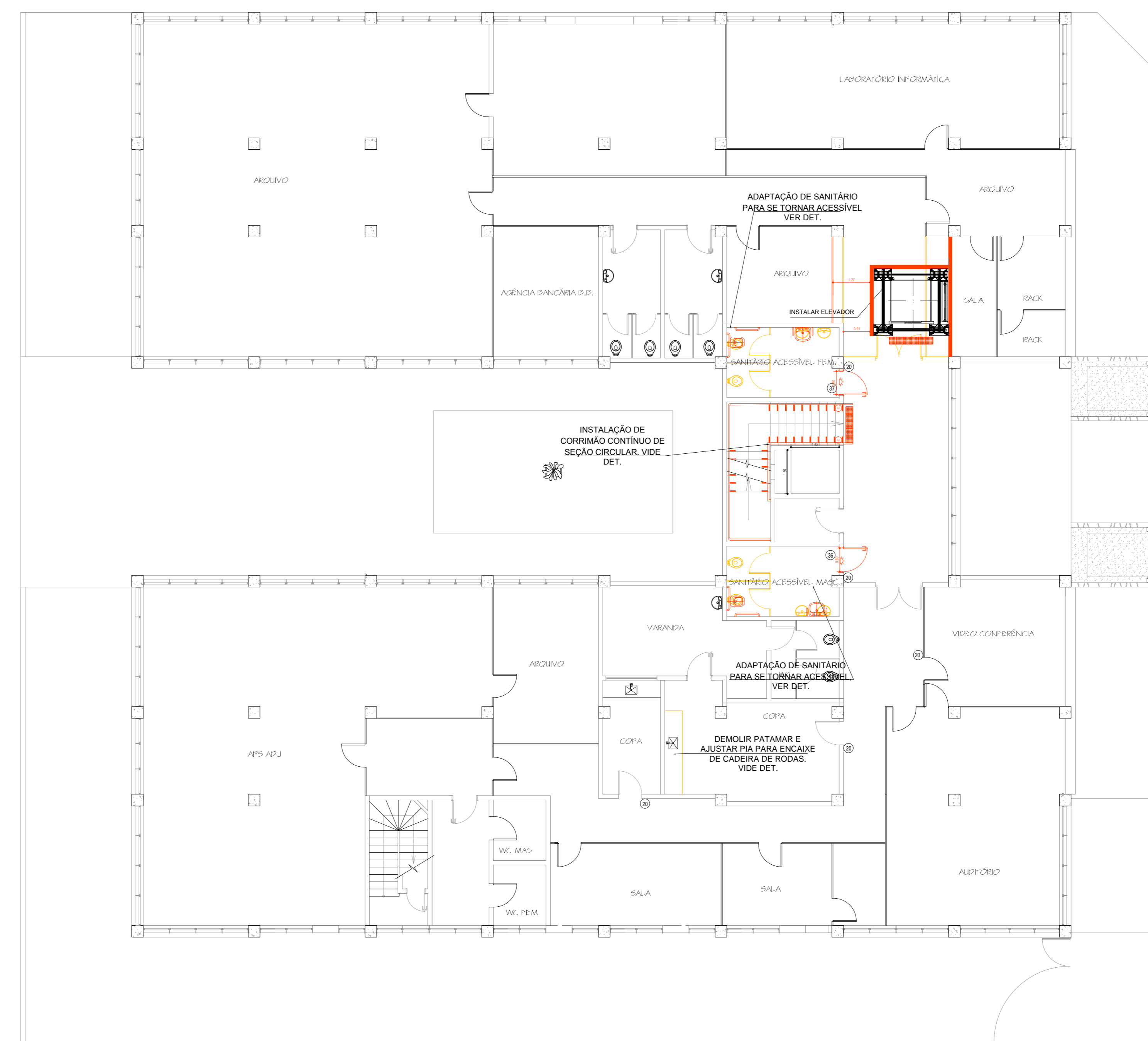
PLANTA BAIXA - Esc.: 1:100 2º ANDAR