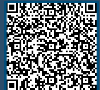
Tabela de Retribuições