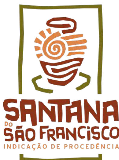
Figura 02 - Representação gráfica da IG a ser aplicada para os padrões de comercialização do Artesanato de Barro.

A representação gráfica e figurativa da Indicação de Procedência "SANTANA DO SÃO FRANCISCO" para o Artesanato de Barro, com distintivo gráfico do tipo misto, de titularidade dos artesãos estabelecidos no território delimitado e coordenada pelo Conselho Regulador da Associação dos Artesãos de Barro de Santana do São Francisco - ARBASSF está assim definida: