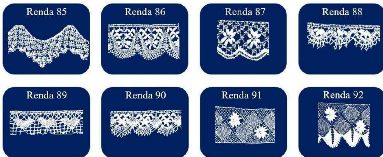
Tabela 1 – Identificação dos tipos de rendas por nome e referência