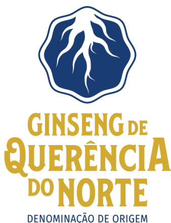
Figura 02 - Representação gráfica da IG a ser aplicada para os padrões de comercialização do Ginseng.

A representação gráfica e figurativa da Denominação de Origem “QUERÊNCIA DO NORTE” para o Ginseng, com distintivo gráfico do tipo misto, de titularidade dos produtores estabelecidos no território delimitado e coordenada pelo Conselho Regulador da Associação de Pequenos Agricultores de Ginseng de Querência do Norte - Estado do Paraná (ASPAG) está assim definida: