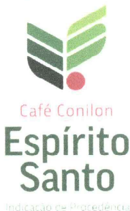
Figura 02 - Representação gráfica da IG a ser aplicada para os padrões de comercialização dos Cafés.

A representação gráfica e figurativa da Indicação de Procedência “ESPÍRITO SANTO” para o Café Conilon, com distintivo gráfico do tipo misto, de titularidade dos produtores estabelecidos no território delimitado e coordenada pelo Conselho Regulador da Federação dos Cafés do Estado do Espírito Santo – FECAFÉS, está assim definida: